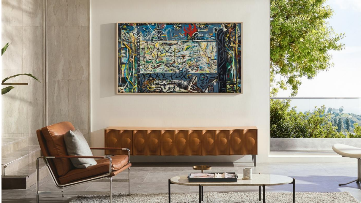
The Frame Pro zeigt „Guardians of the Secret“ von Jackson Pollock (1943).

Zur Kollektion gehören unter anderem ikonische Werke wie Diego Riveras „The Flower Carrier“ (1935), Henri Matisse's „Femme au chapeau“ (1905), Wayne Thiebauds „Display Cakes“ (1963), Jackson Pollocks „Guardians of the Secret“ (1943) und Piet Mondrians „New York City 2“ (1941). Sie sind erstmals außerhalb des SFMOMA auf ausgewählten Samsung Displays in Museumsqualität zugänglich. Die 34 kuratierten Kunstwerke aus der Sammlung des SFMOMA sind eine bedeutende Erweiterung des Angebots an moderner Kunst im Samsung Art Store, wobei erstmals auch Werke der Künstler Robert Rauschenberg und Wayne Thiebaud auf der Plattform verfügbar sind. Nutzer*innen können damit aus einer noch größeren Vielfalt bedeutender Kunst wählen und jeden Raum in eine persönliche Galerie verwandeln.