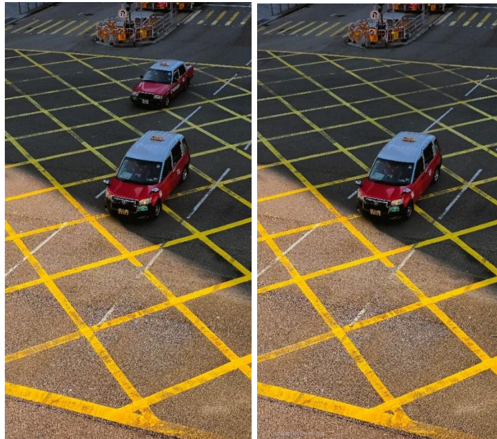
Vorher-Nachher: Generative Bildbearbeitung mit Galaxy AI

verlassen können, um das Bild zu optimieren. Das ist eine einfache Möglichkeit, wertvolle Erinnerungen zu kreieren, ohne das Erleben selbst zu beeinträchtigen.“