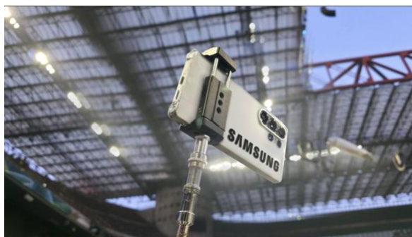
Samsung Galaxy S25 Ultra Smartphones waren Teil der Eröffnungsfeier, und fingen dynamische Perspektiven ein

Bereits die Eröffnungsfeier bot einen ersten Vorgeschmack darauf, wie Samsung Technik die Möglichkeiten erweitert, die Olympischen Spiele zu dokumentieren: In die Live-Übertragung integrierte Samsung Galaxy S25 Ultra Geräte ergänzten die klassischen Broadcast-Kameras und lieferten dynamische Bild-Perspektiven. Auf dem Siegertreppchen hielten Medaillengewinner*innen ihre Emotionen mit dem Galaxy Z Flip7 Olympic Edition und ihren „Sieg-Selfies“ fest. So viele authentische Momente, die das Sieges-Selfie zu einem festen Ritual der Medaillenübergabe gemacht haben.