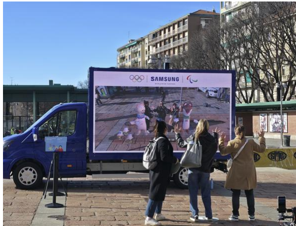
Der Victory Truck bietet ein immersives Olympiaerlebnis

Parallel dazu tourt der Samsung Victory Truck durch Mailand, Bormio und Livigno und macht mobile Technologie rund um die Olympischen Spiele für die Menschen erlebbar. Sie können Fotos mit den Augmented Reality-Maskottchen Tina und Milo machen, diese als QR-Code herunterladen und mit anderen teilen. Ein individuelles, digitales Andenken an die Olympischen Winterspiele.