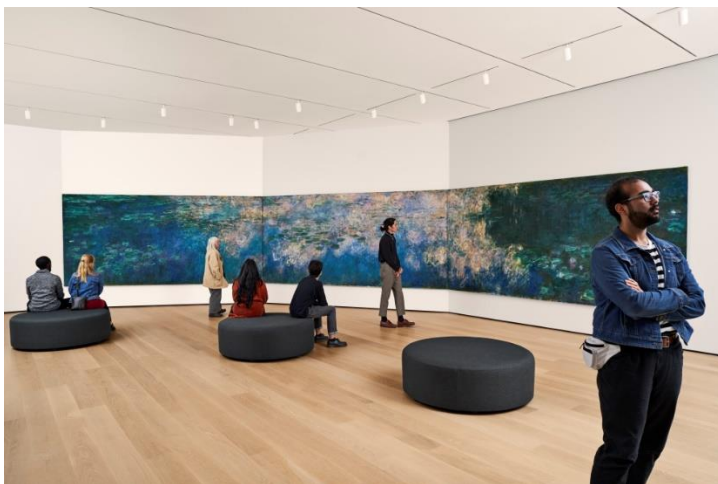
Ein Blick in die Galerie im fünften Stock. Gezeigt: Claude Monet. „Seerosen“. 1914-1926. Öl auf Leinwand, drei Tafeln. Mrs. Simon Guggenheim Fund.