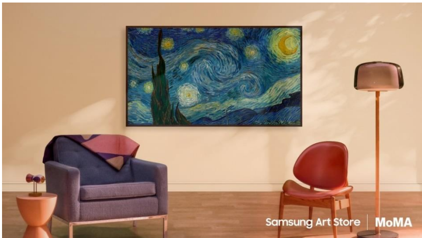
Vincent van Goghs „Sternennacht“ (1889) präsentiert auf The Frame von Samsung

Der Samsung Art Store erweitert sein Angebot um insgesamt 27 Meisterwerke aus der Sammlung des renommierten Museum of Modern Art (MoMA) in New York. Diese Kooperation bietet Kunstbegeisterten die Möglichkeit, eine Vielzahl ikonischer Kunstwerke auf ihrem The Frame TV direkt in ihren eigenen vier Wänden digital zu präsentieren.