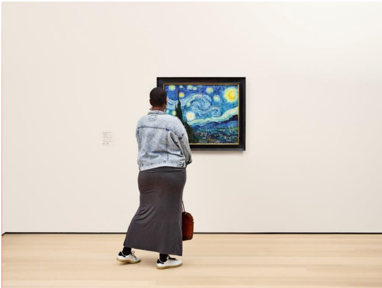
Ein Blick in die Galerie im fünften Stock. Gezeigt: Vincent van Gogh. „Sternennacht“. 1889. Öl auf Leinwand. Erworben durch das Lillie P. Bliss Legat.

„Seit fast 100 Jahren spielt das MoMA eine essenzielle Rolle in der Modernen und Zeitgenössischen Kunst. Durch diese Zusammenarbeit können wir weltbekannte Kunstwerke großartiger Künstler*innen im Samsung Art Store digital zur Verfügung stellen, darunter auch bedeutende weibliche Pionierinnen des 20. Jahrhunderts“, erklärt Daria Greene, Global Curator des Samsung Art Store.