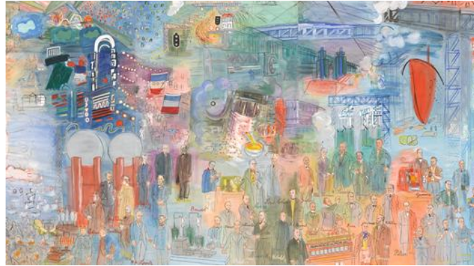
La Fée électricité (1952-1953) von Raoul Dufy

In der Kollektion findet der Anspruch des Centre Pompidou als Schnittstelle von Kunst und Innovation Ausdruck. Gleichzeitig bietet sich dem französischen Museum durch die Partnerschaft mit Samsung eine einzigartige Chance: Die Sammlung bleibt nicht nur weiterhin sichtbar und erlebbar, sondern wird für mehr Menschen denn je zugänglich.