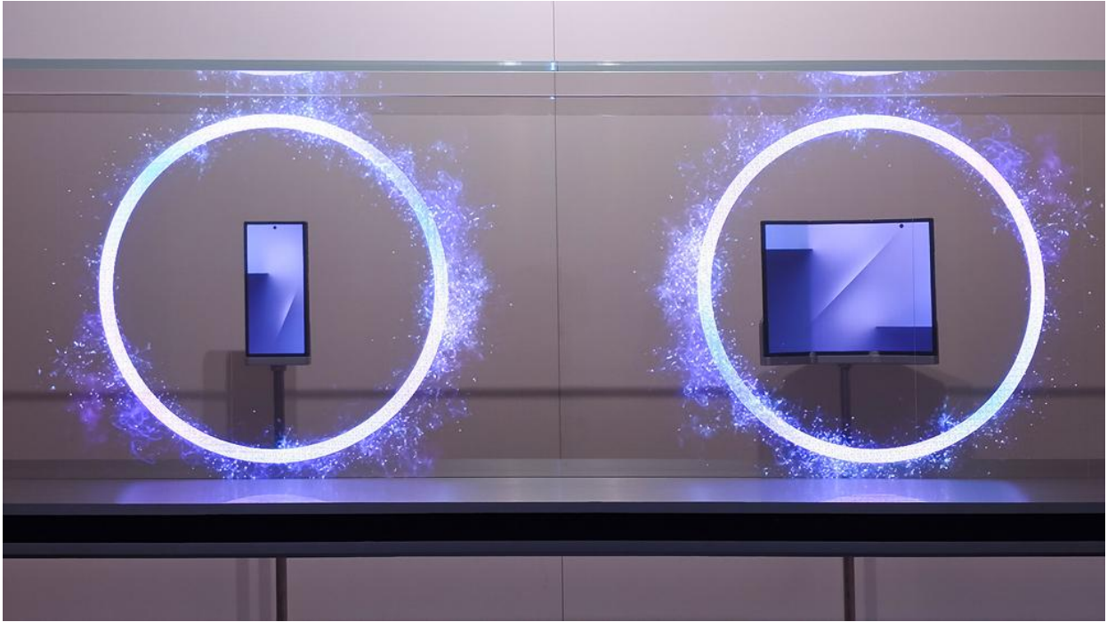
Das Samsung Galaxy Z TriFold