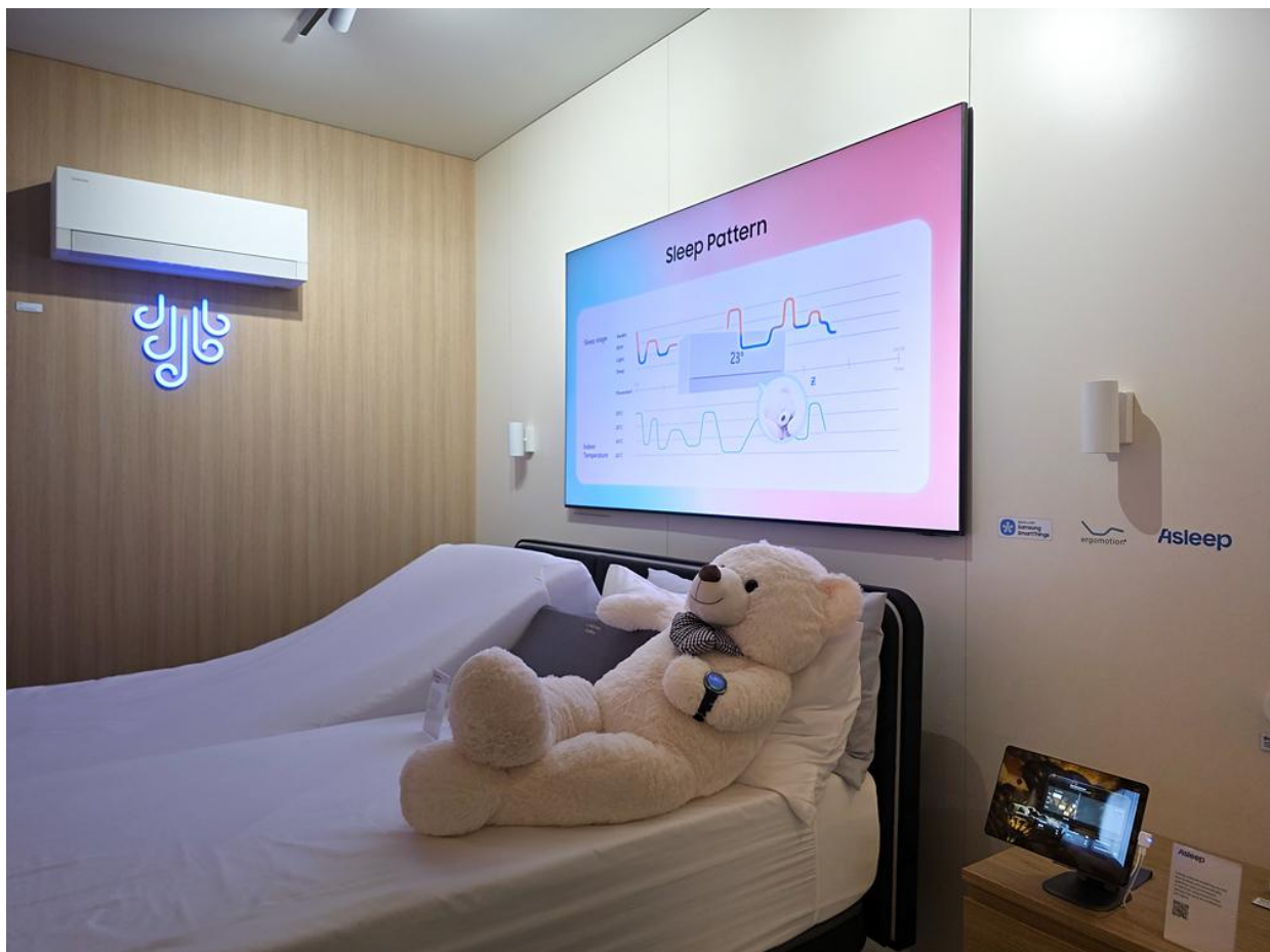
Samsung Galaxy Geräte lassen sich mit Fernsehern und Hausgeräten verbinden, um gute Schlafbedingungen zu schaffen

Im Bereich "Self Care – Good Sleep“ erfuhren die Besucher*innen, wie Wearables wie die Samsung Galaxy Watch und der Galaxy Ring die Schlafbedingungen verfolgen und dabei mit Beleuchtung und vernetzten Hausgeräten wie dem Bespoke AI WindFree Pro und dem Infinite AI Purifier zusammenspielen. Ohne Benutzereingaben passt das vernetzte Zuhause automatisch Temperatur und Belüftung an, um eine angenehmere Schlafumgebung zu schaffen.