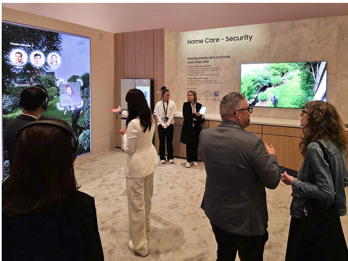
Demonstration der Alarmaktivität

Mit dem AI-Monitoring ihres Zuhauses können sich Benutzer*innen auch unterwegs sicherer fühlen.