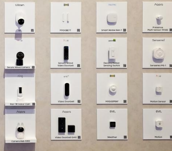
Kompatible Geräte von Partnern

Mit dem Care Companion, der für ein besseres Sicherheitsgefühl, Wohlbefinden und Gelassenheit im Alltag entwickelt wurde, schließt Samsung die Reise „Your Companion to AI Living“ ab, die auf der First Look 2026 im Rahmen der CES präsentiert wurde.