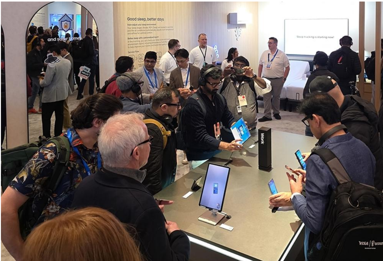
Besucher*innen betrachten das Samsung Galaxy Z TriFold

[Video einbinden] https://youtu.be/Y48W42RnTaY