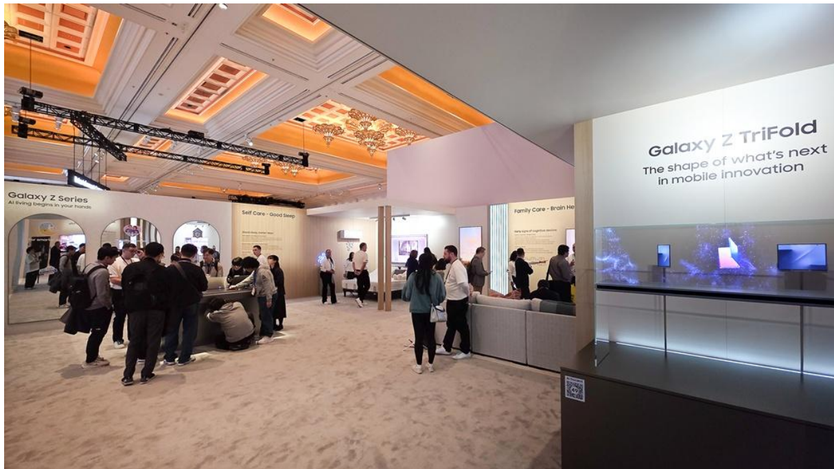
Blick auf die Care Companion Zone

Dieser Bereich der Ausstellung zeigt, wie Samsung Geräte 1 als Dreh- und Angelpunkt für mehr Wohlbefinden und Sicherheit im Alltag werden.