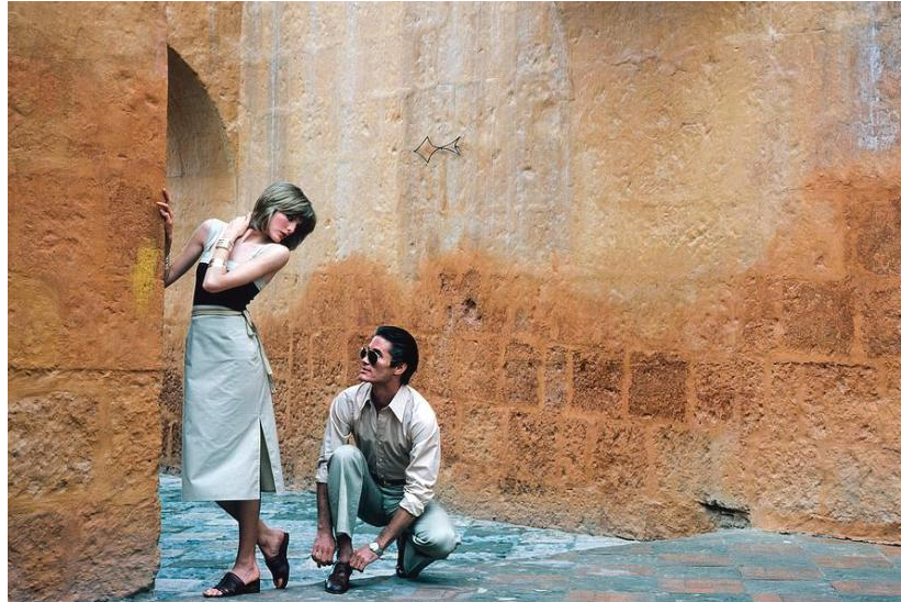
Rene Russo in Arequipa.

Die Partnerschaft mit der Vogue ergänzt die wachsende Sammlung des Samsung Art Store, die bereits über 4.000 Kunstwerke aus mehr als 115 Ländern umfasst, und spiegelt das kontinuierliche Engagement von Samsung wider, Kunst im privaten Umfeld erlebbar zu machen.