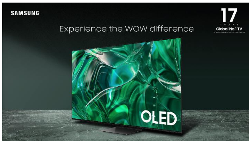
Samsung OLED TV 77 inci, OLED TV dengan body tipis layaknya sinar laser

Samsung Neo QLED 8K TV QN900C yang berlayar 85 inci memiliki layar Infinity Screen yaitu layar dengan nyaris tanpa batas pada bezelnya, lalu didukung dengan Infinity One Design yang menghadirkan ketebalan body TV yang sangat tipis, hanya 15mm, membuat Neo QLED 8K tampak elegan dan indah.