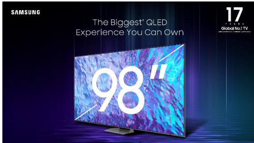
QLED 4K 98 inci, QLED TV terbesar dari Samsung!

Big screen TV dengan resolusi layar 4K yang juga tak kalah WOW adalah Samsung QLED 4K Q80C 98 inci yang merupakan TV QLED 4K terbesar dari Samsung saat ini, dapat menampilkan kualitas gambar yang begitu jernih dan tajam. Samsung QLED 4K ini menjadi QLED TV terbesar 3 yang bisa didapatkan oleh konsumen saat ini di market .