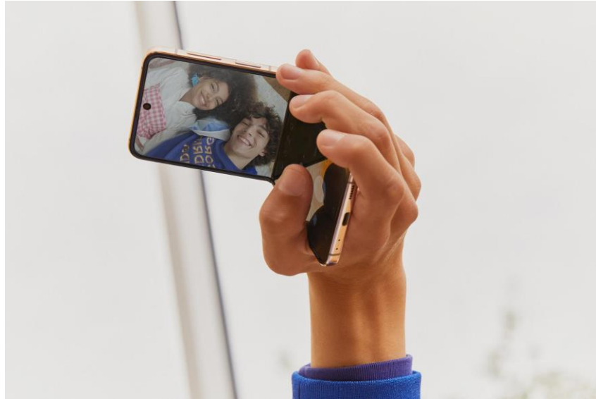
Pengalaman bikin konten jadi naik level berkat Flex Cam di Samsung Galaxy Z series

Selain itu, pengguna dapat tetap terhubung secara real-time melalui cover display yang terus diperbarui, sehingga mereka tidak akan melewatkan notifikasi penting seperti pesan teks, panggilan, atau pengingat harian. Dengan fitur-fitur tersebut, foldable phone Samsung mampu menawarkan pengalaman yang lebih interaktif, praktis, dan terhubung bagi pengguna dalam menjalani aktivitas sehari-harinya.