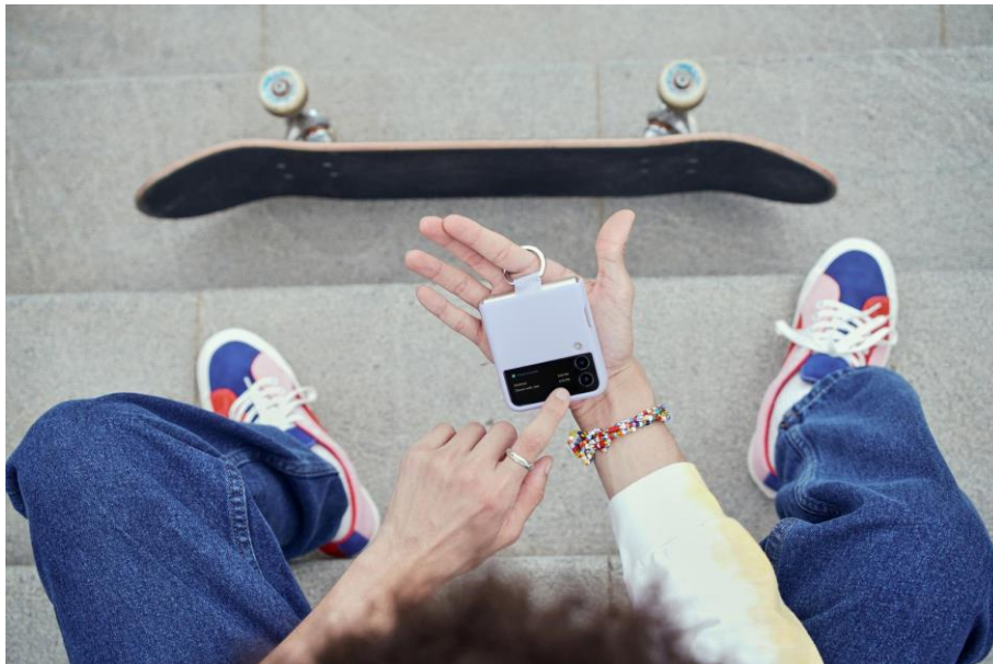
HP lipat Samsung yang cocok untuk dipadupadankan dengan fashion kekinian

Melalui Galaxy Z Fold dan Galaxy Z Flip, Samsung berupaya untuk memenuhi kebutuhan pengguna HP yang mencari perangkat canggih sekaligus penuh gaya untuk mengekspresikan dirinya. Didukung dengan engsel hideaway yang menjadi ciri khas dari foldable phone , sehingga ponsel bisa efektif dalam memberikan keunikan dan menjadi daya tarik tersendiri.