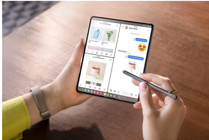
S Pen Fold Edition didesain menjadi lebih ramping dan memudahkan konsumen untuk mencatat di layer utama

Taskbar yang lebih baik memungkinkan produktivitas yang dinamis dengan membuat pengguna bisa beralih ke antar aplikasi yang sering digunakan dengan cepat. Kini, pengguna bisa menyiapkan hingga empat recent apps untuk bekerja dengan lebih efisien. Fungsi two-handed drag and drop 20 yang telah disempurnakan juga mampu meningkatkan produktivitas saat pengguna memindahkan konten antar aplikasi dan layar. Cukup sentuh dan tahan sebuah gambar dari Samsung Gallery dengan satu jari, lalu gunakan jari lainnya untuk buka aplikasi Samsung Notes untuk drag-and-drop gambar tersebut. Dengan hidden pop-up 21 , aplikasi bisa terus berjalan in-background , memungkinkan pengguna untuk menonton konten video secara full-screen dan chat dengan teman dalam floating pop-up di sisi layar.