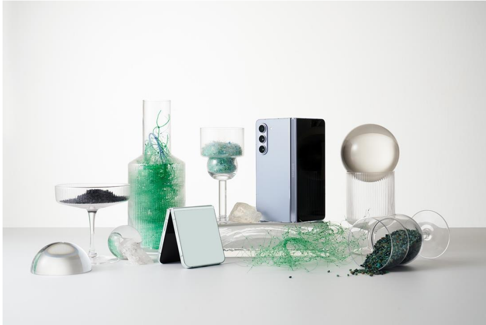
Samsung mendukung gaya hidup eco-friendly melalui kehadiran device Galaxy Z Flip5|Fold5

Samsung terus menunjukkan kemajuan pada visi lingkungan perusahaan dan mengakselerasi berbagai aksi yang mampu mencapai berbagai tujuan yang telah dicanangkan, termasuk dalam mencapai net zero carbon emissions pada akhir 2030 untuk Device eXperience Division.