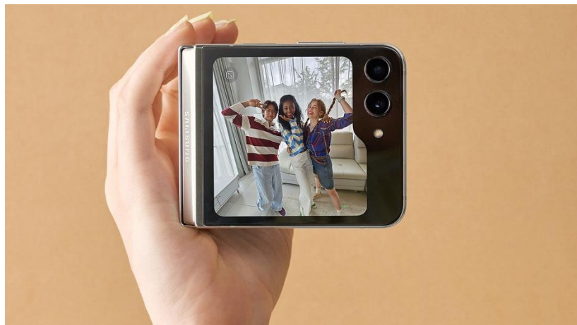
Galaxy Z Flip5 dilengkapi FlexCam dan mendukung pengguna mengeksplorasi angle lebih bebas

Saat ditutup, Galaxy Z Flip5 menghadirkan lebih banyak kegunaan dibanding para pendahulunya. Cukup melalui Flex Window, pengguna bisa mengakses berbagai informasi dengan cepat dan mudah. Dengan Widgets , pengguna bisa melihat perkiraan cuaca, mengatur pemutaran musik dan mendengarkan lagu favoritnya dengan Media Controller 8 , atau mengikuti perkembangan terkini dari pasar saham global dengan widget Google Finance. Pengguna pun bisa melihat semua Widget dalam sekejap dan beralih antara widget secara instan dengan pinch layar untuk mengaktifkan Multi Widget View . Ditambah lagi, pengguna juga bisa dengan mudah memeriksa notifikasi dan mengakses Quick Settings untuk mengaktifkan Wi-Fi atau Bluetooth. Tanpa perlu membuka perangkat, telusuri riwayat panggilan untuk membalas panggilan tak terjawab dan balas teks dalam perjalanan dengan Quick Reply dengan keyboard QWERTY lengkap dan riwayat obrolan yang dapat dilihat. Cukup dengan swipe up layar, akses Samsung Wallet 9 untuk bayar saat on-the-go serta akses kode QR, kupon, boarding pass , kartu berlangganan, kunci digital, dan health pass .