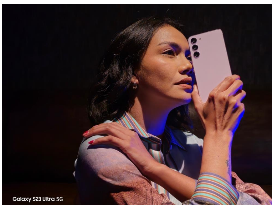
Menggunakan Fitur Expert RAW untuk Mengambil Foto Editorial Bagaimana Memakai Kamera Profesional

Berkat algoritma ISP berbasis AI terbaru dan penggandaan sudut OIS di semua arah, Galaxy S23 Ultra 5G mampu mengoreksi noise dengan lebih optimal sekaligus menampilkan lebih banyak detail dan warna saat memotret di kala low light. Menurut Nicoline, salah satu fitur yang patut dicoba untuk membuat low light fashion photography yang epic dengan Galaxy S23 Ultra 5G adalah Night Portrait. “Dengan fitur ini, kita bisa mendapatkan low light portrait yang lebih detail dan realistis yang bikin outfit kita lebih standout walau cahaya di sekitar minim. Penggandaan sudut OIS pun bikin perangkat lebih stabil saat pakai shutter speed lambat, jadi kita bisa mendapat hasil foto yang maksimal di kondisi low light ,” ucap Nicoline.