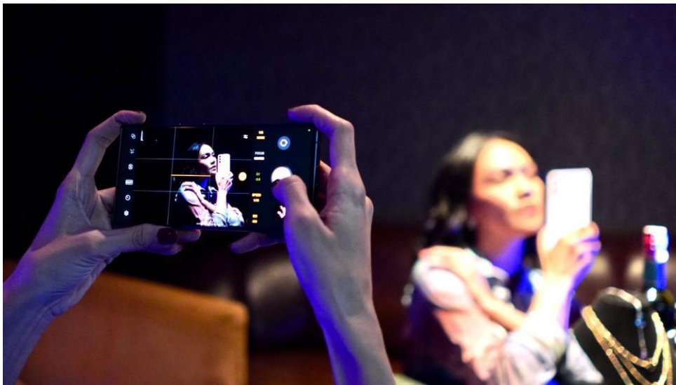
Buat Konten Fashion Photography Jadi Lebih Epic dengan Inovasi Kamera Galaxy S23 Ultra 5G

"Dengan Galaxy S23 Ultra, siapa saja bisa share sisi paling epic dari kepribadian maupun aspirasi fashion -nya melalui fashion photography dan mendapatkan hasil foto sekelas profesional dengan lebih mudah. Pasalnya, Galaxy S23 Ultra 5G telah didesain untuk menjawab kebutuhan konsumen dalam membuat konten berkualitas tinggi berkat fitur-fitur kamera terdepan seperti Adaptive Pixel 200MP, Nightography, hingga Expert RAW yang ditingkatkan untuk hasil konten yang lebih epic di tiap kondisi," ujar Verry Octavianus , Product Marketing Manager Samsung Mobile Experience, Samsung Electronics Indonesia .