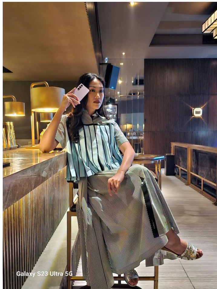
Adaptive Pixel 200 MP Mampu Menangkap Kecantikan Outfit Artkea Stripes dengan Detail yang Epic

Jika kamu punya koleksi outfit branded , kamu bisa coba buat konten high fashion photography . Walau lebih mengedepankan konsep yang sederhana, high fashion photography identik dengan hasil eksekusi yang elegan untuk memunculkan daya tarik tersendiri bagi yang melihatnya. Hal ini pun cocok buat kamu yang mau menyalurkan jiwa model yang ada di dalam diri kamu.