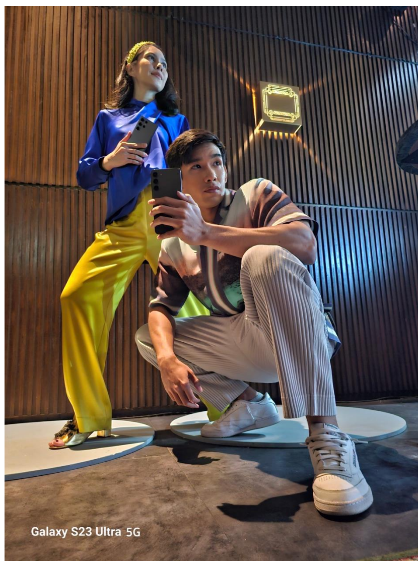
Menggunakan Lensa Ultra Wide Pada Galaxy S23 Ultra 5G untuk Tampilan Full Body Look yang Lebih Epic

Fashion photography telah menjadi sumber inspirasi bagi banyak orang dari waktu ke waktu, apalagi bagi yang suka menjadikan majalah fashion sebagai rujukan style . Rasa terinspirasi ini pun mendorong banyak orang untuk membagikan penampilannya yang epic dalam bentuk konten, di mana konten full body look terus populer di kalangan pengguna media sosial. Dalam hal ini, menurut Nicoline, full body look yang epic dapat dibuat dengan permainan angle, seperti low angle maupun eye level .