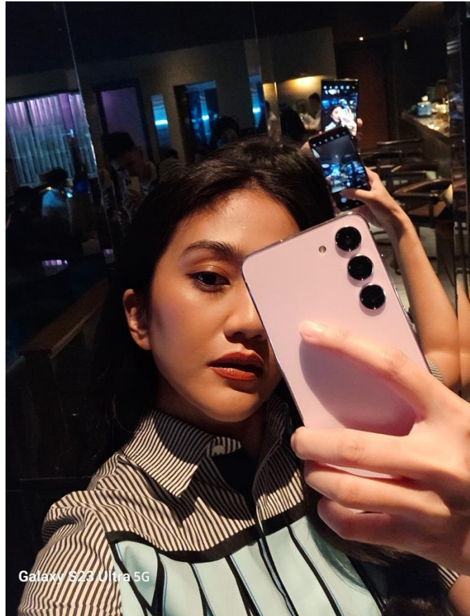
Teknologi Super HDR pada Kamera Selfie pada Galaxy S23 Ultra 5G Hasilkan Gambar yang Jernih Meski Kondisi Lowlight

Selain itu, untuk capture fokus area yang lebih spesifik dengan lebih mudah, kita juga bisa pakai kamera depan. Walau tidak semua smartphone memiliki kamera depan yang cukup mumpuni dalam menghasilkan gambar yang jernih, Galaxy S23 Ultra 5G hadir sebagai pembeda berkat kamera depan Super HDR sehingga hasil selfie bisa lebih tajam untuk mempertegas detail dari kreasi high fashion photography . “Dengan kamera depan Super HDR, kita bisa create konten fashion yang lebih detail dan aesthetic dengan fokus ke hal-hal yang mungkin tak terbayangkan seperti aksesoris, apalagi dengan fashion item high-end yang menambah kesan elegan dari foto yang kita ambil,” ucap Nicoline.