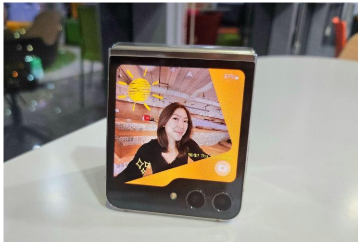
Kreasikan Cover Screen Sesuai Style dan Mood Kamu untuk Tampilan yang Unik

Sekarang kamu tinggal atur hasil gif menjadi wallpaper di Cover Screen. Tak hanya itu, atur juga style tampilan Cover Screen dengan pilihan frame dan gaya font yang lucu-lucu. Terdapat berbagai pilihan bentuk dan warna frame yang bisa dipilih sesuai outfit yang ingin kamu tampilkan di foto OOTD. Kamu juga bisa ganti font , ukuran hingga penempatan clock style pada Cover Screen supaya matching dengan background -nya. Kreasi Cover Screen sudah sesuai dengan outfit dan aksesoris, sekarang saatnya buat foto OOTD!