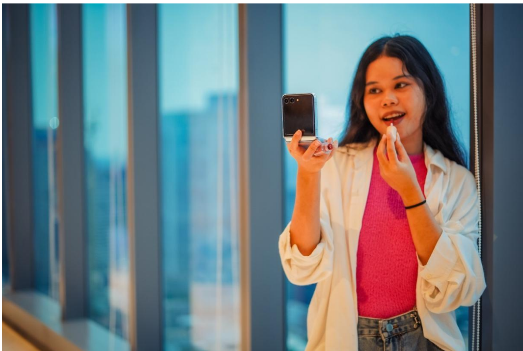
Konten daily make up routine jadi lebih praktis menggunakan fitur Flex Mode dari Samsung Galaxy Z Flip5

Konten GRWM punya banyak ide yang bisa diangkat sesuai dengan daily routine yang kamu suka. Misalnya, kalau kamu suka merias wajah sebelum pergi, kamu bisa bikin konten GRWM dengan tema daily makeup inspiration . Kamu pun bisa bikin konten GRWM yang fokus soal makeup dengan lebih mudah menggunakan Galaxy Z Flip5.