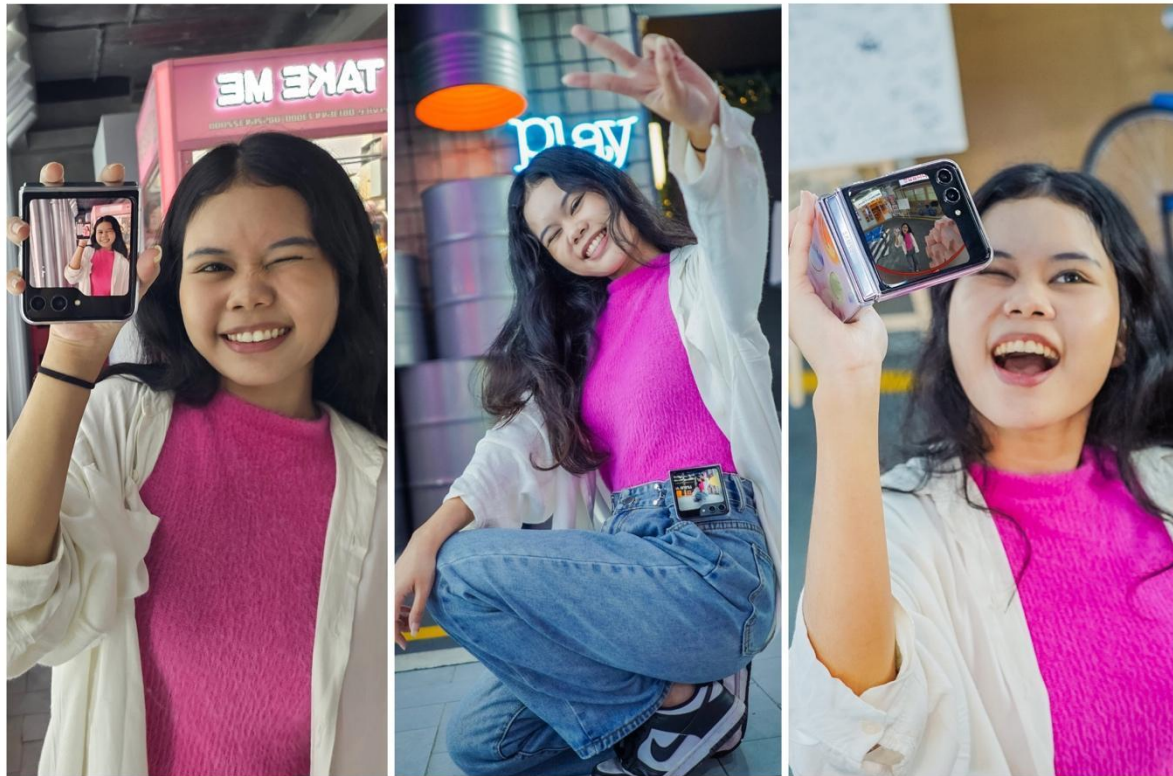
Mirror selfie menjadi lebih kece dengan Flex Window yang lebih besar

Saat bikin konten GRWM, jangan lupa ambil foto yang akan kamu jadikan sebagai thumbnail dari konten, baik itu ketika di- upload ke TikTok ataupun Instagram Reels. Nah, salah satu inspirasi untuk bikin thumbnail yang beda adalah dengan capture mirror selfie . Kamu pun bisa level up hasil mirror selfie kamu dengan lebih mudah menggunakan Galaxy Z Flip5.