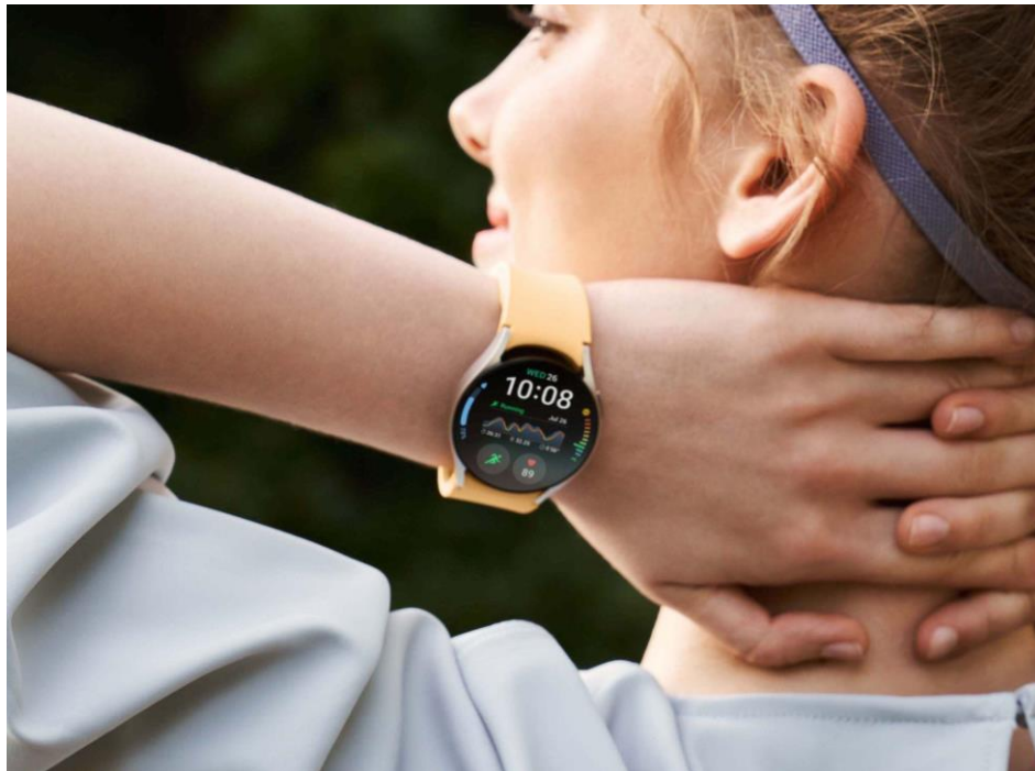
Pantau Tekanan Darah kamu dengan Fitur Blood Pressure dan Kondisi Tubuh dengan Fitur Body Composition Setiap Harinya

Untuk semakin memahami kondisi tubuh kamu, kamu juga bisa pakai fitur Blood Pressure Monitoring yang dapat mengukur tekanan darah dan gelombang denyut nadi kamu agar menjaga kondisi tubuh tetap sehat dan fit. Tak ketinggalan, ada fungsi Body Composition untuk melacak berbagai kondisi tubuh secara akurat, mulai dari berat badan, massa otot, kadar lemak, kadar air, BMI, hingga BMR, untuk mendukung kamu mempertahankan gaya hidup sehat di tengah kualitas udara yang kurang menyehatkan seperti sekarang ini.