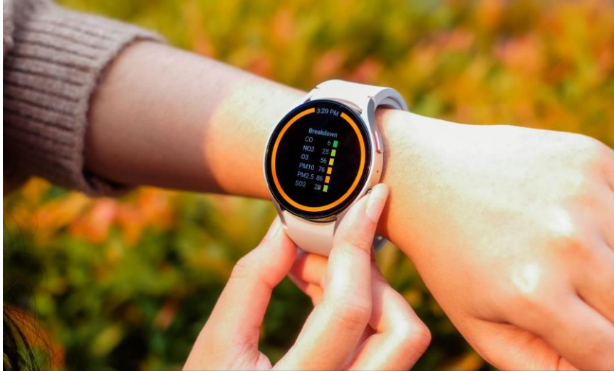
Lihat dan Ukur Kondisi Kualitas Udara di Galaxy Watch6 Series Kamu!

Untuk menjaga gaya hidup tetap sehat dan produktivitas tetap maksimal, kita juga harus memastikan kualitas istirahat. Untuk itu, Galaxy Watch6 Series hadir layaknya sleep coach pribadi untuk meningkatkan kualitas tidur kamu. Pakai fitur Sleep Monitoring untuk pantau sleep consistency , sleep stages , hingga kondisi kalori yang terbakar selama 7 hari untuk mendapatkan sleep symbol berupa hewan yang merepresentasikan kualitas tidur kamu. Dari hasil analisis itu, cukup lanjut pakai fitur Sleep Coaching untuk mendapat to-do-list terpersonalisasi yang perlu dilakukan tiap hari demi mendapatkan tidur yang berkualitas. Kamu juga bisa melihat insight berupa artikel dan video yang akan mendukung analisis dan kebiasaan tidur kamu secara lengkap di smartphone yang connect ke Galaxy Watch6 Series.