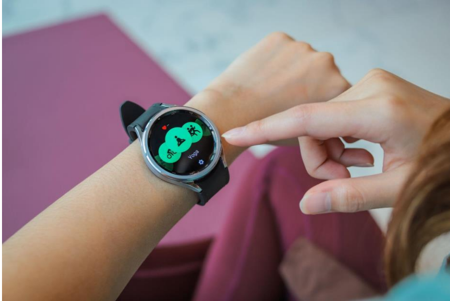
Kustomisasi Olahraga Indoor Sesuka Kamu dengan Opsi Custom Workout dan Fitur Olahraga Lain pada Galaxy Watch6 Series untuk Dukong Kamu Tetap Fit

Menariknya lagi, kamu bisa set workout routine dengan menggabungkan pilihan olahraga yang tersedia dengan memilih opsi tambah pada 'exercise tile' dan memilih 'create custom workout'. Kamu pun bisa melacak setiap tahap dan jenis olahraga yang kamu lalui dan mendapatkan hasil analisis yang komprehensif, seperti jumlah kalori yang terbakar. Dengan begitu, kamu bisa membuat rutinitas latihan yang personalised sambil melacak setiap sequence latihan secara akurat serta menentukan target sesuai kebutuhan dan kemampuan tubuh.