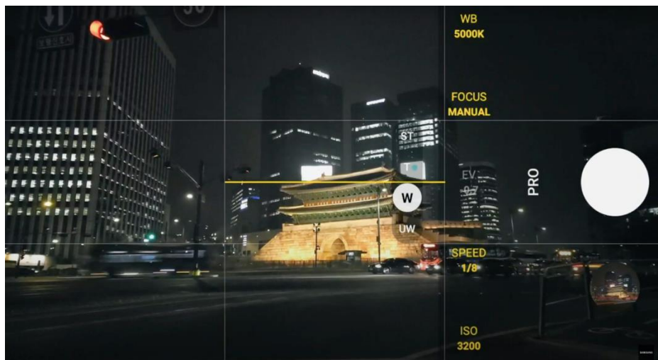
Pilih Pro Mode dan ubah pengaturan hasil konten layaknya profesional