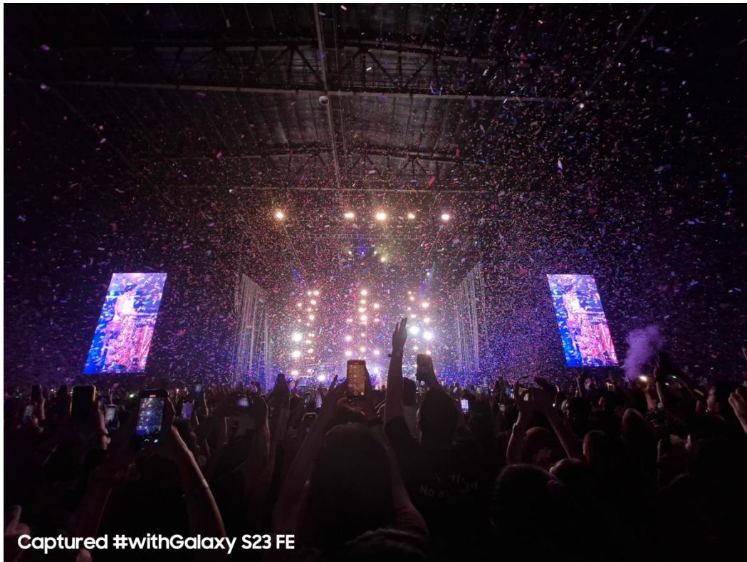
Foto kamu bisa jadi lebih dramatis dengan memanfaatkan fitur pengaturan cahaya yang tersemat pada kamera Galaxy S23 FE