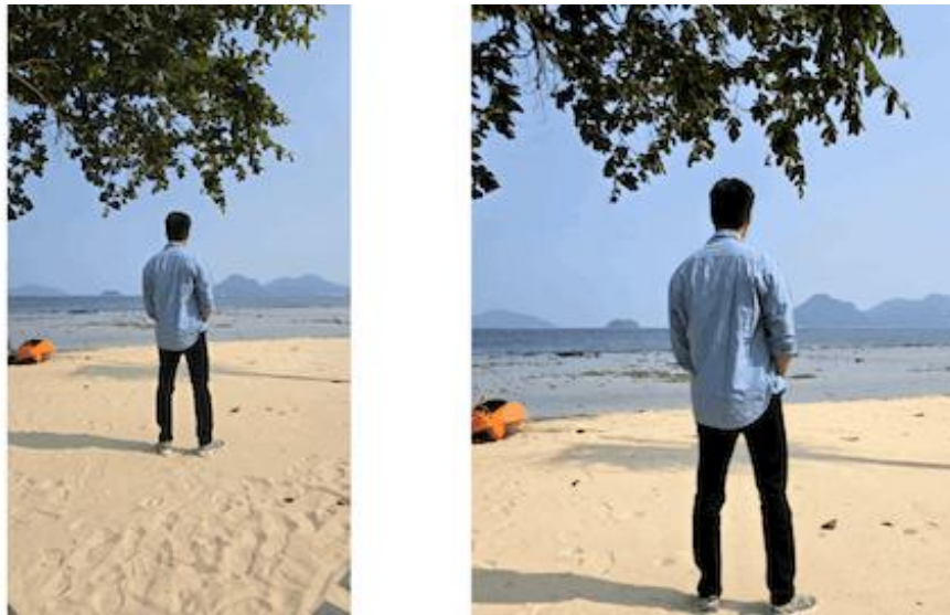
Manfaatin fitur Live Effect untuk membuat video parallex effect dengan waktu singkat

yang keren dalam video traveling kamu. Fitur ini memungkinkan konten 2D yang still menjadi konten 3D yang punya motion , sehingga konten kamu menjadi lebih eye-catching .