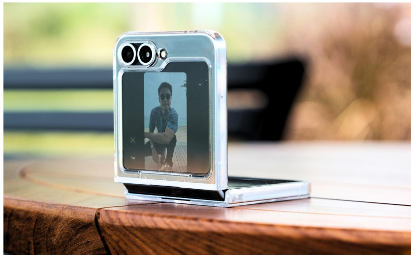
Fitur Auto Zoom digunakan dari Cover Screen Galaxy Z Flip6

Saat ini, semakin banyak orang yang memilih untuk solo traveling karena bisa lebih fleksibel dalam menyusun itinerary . Namun, jika bicara soal content creation , kita bisa menemukan tantangan saat mengabadikan momen jalan-jalan saat solo traveling . Misal, bagaimana cara mengambil konten full body dengan latar belakang yang bagus tanpa bantuan teman?