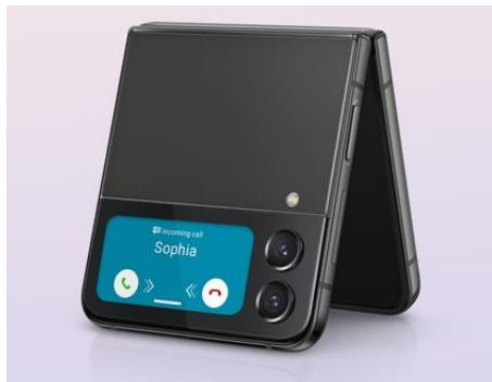
Tampilan Panggilan pada Cover Screen Galaxy Z Flip4 5G

Selain pengalaman membuat konten yang lebih menarik, Galaxy Z Flip4 5G juga menghadirkan pengalaman berkomunikasi yang lebih praktis karena kini kita bisa menelepon dan membalas pesan langsung dari Cover Screen. Saat perangkat dalam keadaan terlipat, Cover Screen akan tetap menampilkan tampilan panggilan masuk layaknya smartphone pada umumnya. Dengan begitu, kita bisa dengan mudah menjawab telepon tanpa membuka perangkat. Cukup tap Cover Screen lalu swipe ke kanan untuk menjawab, kita bisa terhubung dengan lawan bicara secara hands-free .