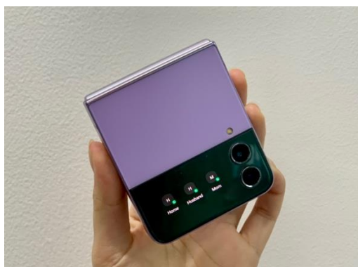
Direct Dial pada Cover Screen Samsung Galaxy Z Flip4 5G

Atau ada pilihan widget yaitu direct dial untuk menyimpan 3 nomor penting yang akan tampil di cover screen agar dapat melakukan panggilan langsung tanpa harus membuka perangkat.