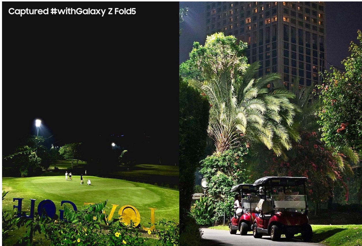
Mengabadikan pemandangan sekitar lapangan golf di malam hari tetap terlihat vivid dan cerah karena kemampuan Night Mode

memungkinkan kamu untuk mendapatkan konten sekeliling yang tetap terang.