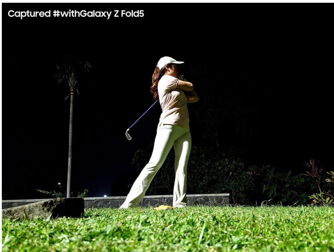
Abadikan teknik swing golf kamu dengan low angle menggunakan Flex Cam pada Galaxy Z Fold5

Pertama-tama, kamu bisa explore sudut-sudut menarik saat mengambil foto self portrait saat melakukan swing golf dengan memanfaatkan Flex Cam sebagai tripod . Letakkan Galaxy Z Fold5 dalam keadaan tertekuk sejajar dengan permukaan tanah. Kamu bisa meletakkannya di rumput untuk mengambil sudut rendah atau bisa juga di kereta golf untuk mengambil angle sejajar mata atau angle tinggi untuk hasil yang bervariasi.