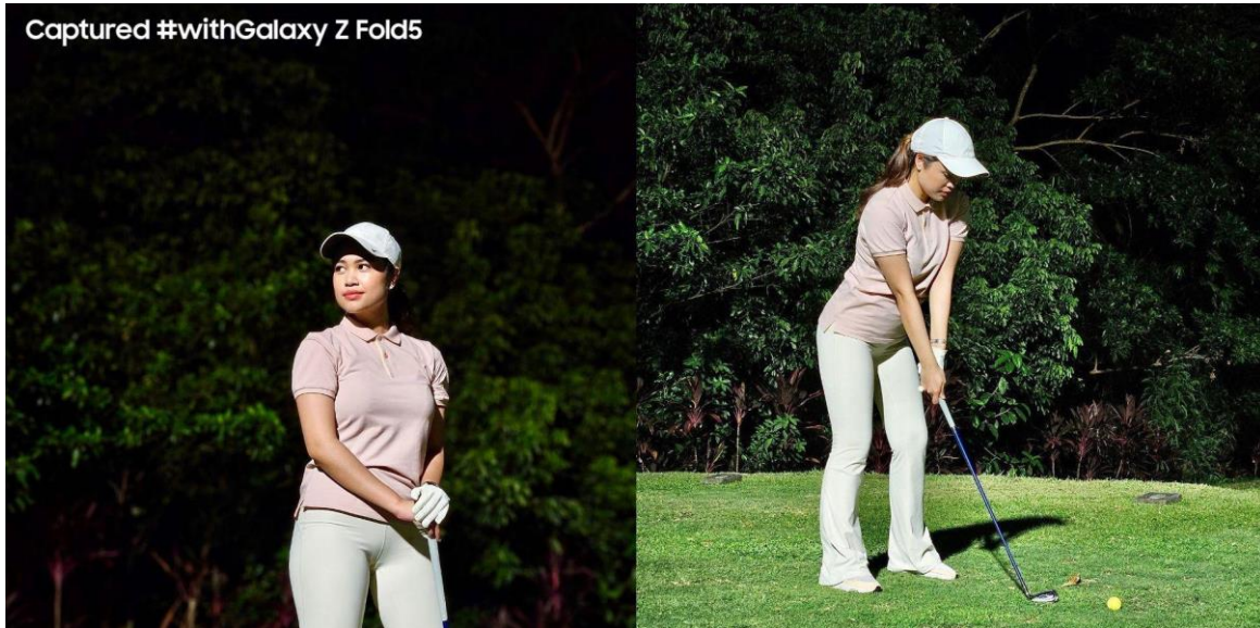
Detail foto olahraga terlihat lebih cerah dan presisi dalam kondisi lowlight menggunakan Expert RAW

Masih beginner tapi mau coba teknik fotografi unik saat bermain golf? Sadam punya trik anti ribet dan gampang buat kamu explore teknik fotografi ala profesional pakai Expert RAW. Kamu bisa mencoba beragam teknik fotografi dengan pengaturan yang simpel. Bahkan, kamu juga bisa mencoba teknik-teknik unik seperti Multi Exposure untuk menggabungkan foto teknik melakukan swing dengan foto latar belakang scenery gedung-gedung di sekitar lapangan golf layaknya fotografer profesional.