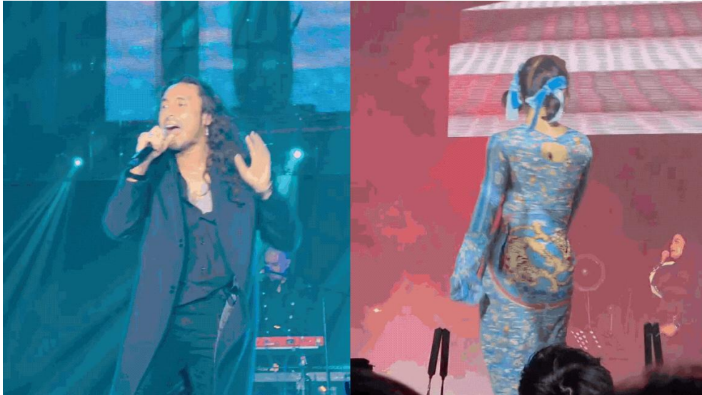
Kemampuan Nightography Galaxy S25 Series memaksimalkan pengambilan video konser dalam kondisi lowlight

Nightography adalah fitur unggulan Galaxy S Series untuk merekam momen konser dalam pencahayaan rendah. Fitur ini terus ditingkatkan untuk menghasilkan gambar lebih terang, minim noise, dan detail yang tajam. Dengan algoritma pemrosesan gambar yang selalu terdepan, Galaxy S Series mampu menangkap detail yang lebih tajam meskipun dalam kondisi pencahayaan rendah. Di Galaxy S25 Series, Nightography semakin optimal dengan 10-bit HDR dan peningkatan pada Nightography Video, memungkinkan pengguna menangkap foto dan video berkualitas tinggi dalam kondisi gelap, menjadikannya pilihan tepat bagi penggemar konser.