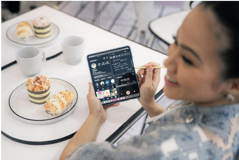
Kemampuan multitasking Galaxy Z Fold5 buat Penyanyi Yura Yunita Kepincut #JoinTheFlipSide

Bagi Yura Yunita, user experience menjadi hal yang penting dalam memilih smartphone . Inilah yang membuat dirinya beralih menggunakan Galaxy Z Fold5, karena user experience yang ditawarkan memungkinkan Yura untuk multitasking dengan praktis. Galaxy Z Fold5 memberi kemudahan lebih bagi Yura saat beraktivitas dan menuangkan ide-ide kreatif di mana pun dan kapan pun. Terlebih dengan kemampuan Multi Window memudahkan Yura untuk membuka tiga aplikasi sekaligus secara bersamaan.