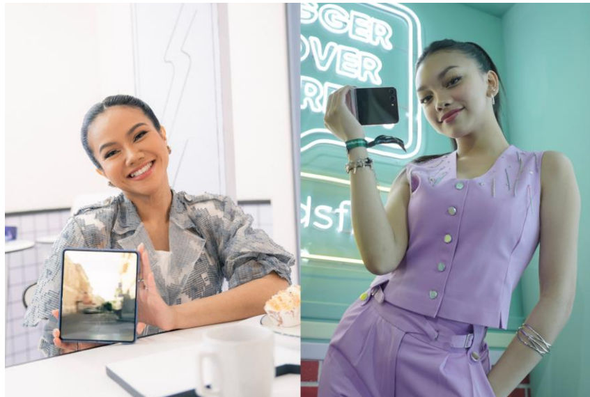
Deretan artis hingga gamers coba pengalaman smartphone Galaxy pakai Try Galaxy sebelum switch ke Galaxy Z Fold5 dan Z Flip5

Jakarta, 14 September 2023 – Buat kamu yang FOMO, langsung unduh aplikasi Try Galaxy sekarang untuk menikmati pengalaman baru Galaxy Z Fold5|Flip5 di smartphone kamu yang belum Galaxy smartphone atau non Android. Di update terbaru Try Galaxy, kini pengguna ponsel non-Android bisa merasakan langsung kenyamanan sistem operasi One UI 5.1.1 yang intuitif sambil menjelajahi fitur-fitur dari Galaxy Z Fold5 dan Z Flip5 terbaru.