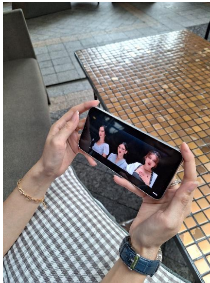
Galaxy A34 5G dilengkapi fitur Vision Booster dengan level brightness 1.000nits, layar akan menyesuaikan dengan pencahayaan di sekitar termasuk saat streaming di outdoor

Dengan aspect ratio 19.5:9 kamu akan menikmati pengalaman sinematik. Refresh rate 120Hz jelas bikin transisi konten di layar hape terlihat mulus, tak ada efek patah-patah. Layar hape ini sudah memiliki level brightness 1000nits dengan vision booster , untuk menghasilkan layar yang 25 persen lebih terang ketimbang pendahulunya. Streaming konten di siang hari tak masalah, begitu pun saat malam. ponsel ini sudah dilengkapi dengan fitur Eye-Comfort Shield yang bikin mata tetap nyaman meski menonton dalam waktu lama dan memfilter efek Blue Light.