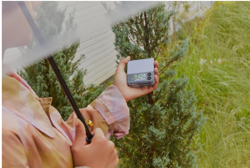
Samsung Z Series dirancang dengan bahan yang kuat dan kualitas yang baik untuk memastikan ketahanan dan keandalan dalam jangka waktu yang Panjang

Awalnya, hinge hanya mengakomodasi gerakan membuka dan menutup secara penuh, namun kini engsel tersebut memungkinkan perangkat tetap kuat saat dilipat dalam berbagai angle . Perkembangan tersebut penting untuk memberikan pengalaman terbaik bagi pengguna ketika menggunakan fitur Flex Mode di Galaxy Z Flip untuk membuat konten, menonton video, hingga melakukan conference call .