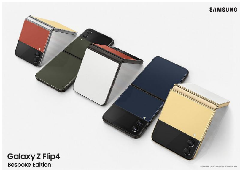
Samsung meluncurkan edisi khusus Galaxy Z Flip 4 Bespoke yang memungkinkan pengguna untuk mengungkapkan kreativitas mereka dengan memilih warna perangkat sesuai keinginan

Selain itu, ketika memperkenalkan Galaxy Z Flip4, Samsung turut menyediakan Bespoke Edition untuk perangkat tersebut. Galaxy Z Flip4 Bespoke Edition menawarkan 75 kombinasi warna pada bodi kaca dan pilihan rangka perangkat sehingga memungkinkan pengguna untuk benar-benar mengatur tampilan dari perangkat sesuai dengan preferensinya. Bahkan, pada HUT ke-77 RI, Samsung sempat merilis Galaxy Z Flip4 Indonesia Bespoke Edition dengan warna merah-putih lengkap dengan aksesoris yang tersedia terbatas.