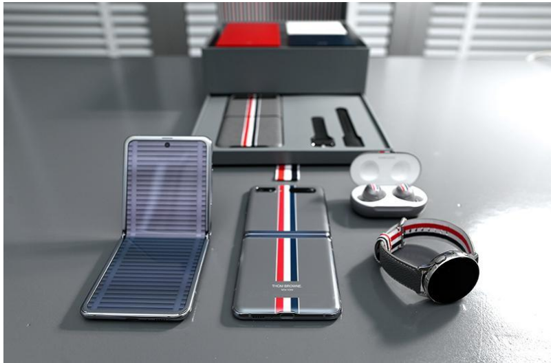
Kolaborasi antara Samsung dan Thom Browne, menampilkan desain unik dan eksklusif dengan sentuhan gaya klasik.

Selain itu, ketika memperkenalkan Galaxy Z Flip4, Samsung turut menyediakan Bespoke Edition untuk perangkat tersebut. Galaxy Z Flip4 Bespoke Edition menawarkan 75 kombinasi warna pada bodi kaca dan pilihan rangka perangkat sehingga memungkinkan pengguna untuk benar-benar mengatur tampilan dari perangkat sesuai dengan preferensinya. Bahkan, pada HUT ke-77 RI, Samsung sempat merilis Galaxy Z Flip4 Indonesia Bespoke Edition dengan warna merah-putih lengkap dengan aksesoris yang tersedia terbatas.