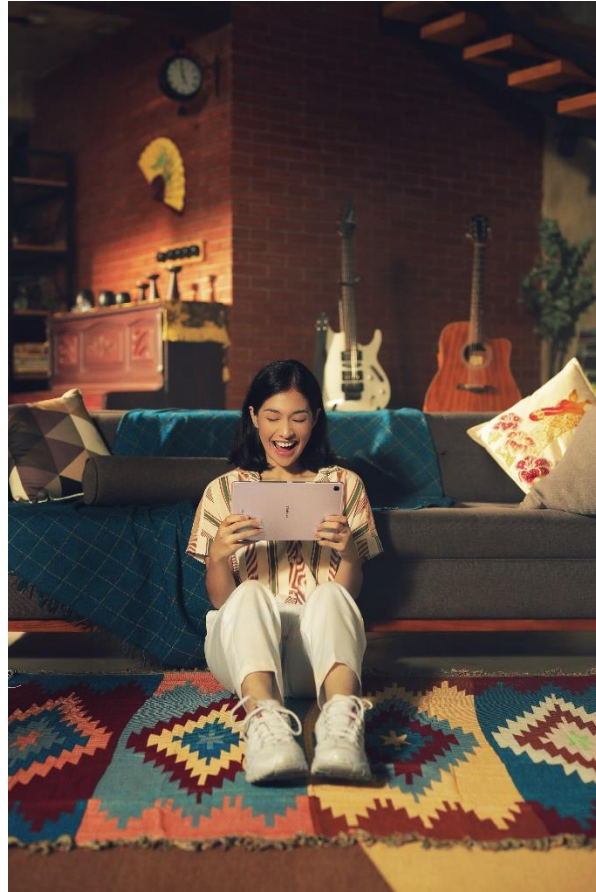
Nikmati bermacam konten dengan Galaxy Tab S6 Lite

Tidak hanya untuk menikmati hiburan, kamu juga bisa mengikuti tutorial yoga, aerobik, Zumba, atau bahkan pilates dari YouTube untuk menjaga kebugaran tubuh.