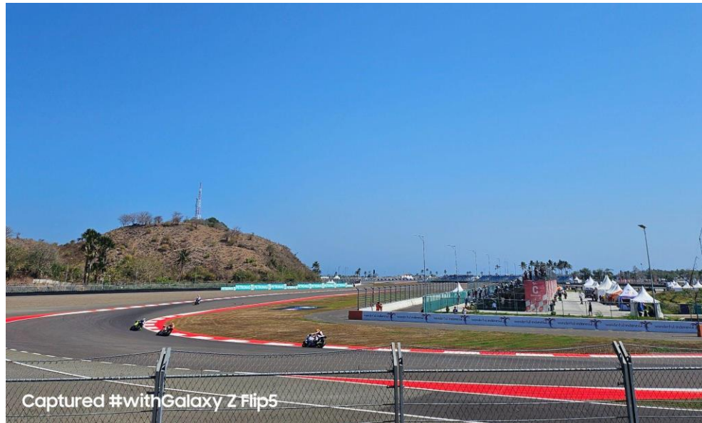
Ciptakan hasil foto berkualitas berkat teknologi kamera Galaxy Z Flip5 yang dilengkapi dengan Optical Image Stabilization

Tangkap foto terbaik pembalap jagoan kamu dengan kamera 12MP dan Optical Image Stabilization