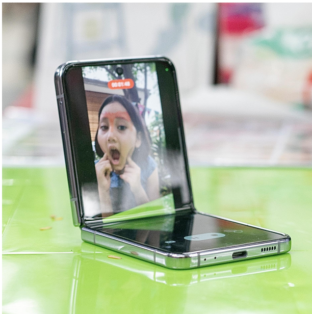
Menggunakan FlexMode untuk merekam konten face painting anak di festival dengan hands-free

Orang tua juga bisa explore topik-topik konten yang menarik yang disukai anak-anak. Ada berbagai topik yang bisa digali di sini, seperti komedi dari kegiatan sehari-hari, seni, unboxing, DIY, gaming, atau olahraga. Apa pun topik yang dipilih dan disukai anak, Galaxy Z Flip4 5G bisa memudahkan para orang tua dan anak untuk bikin konten bersama.