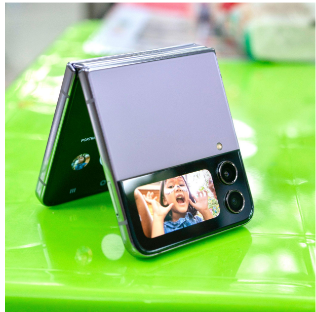
Merekam kegiatan anak menggunakan rear camera melalui cover screen

Misalnya, si anak suka nonton konten DIY dan senang membuat kerajinan tangan. Orang tua bisa memaksimalkan fleksibilitas dari Galaxy Z Flip4 5G untuk encourage anak membuat konten DIY versinya sendiri. Cukup pakai FlexMode, perangkat bisa diletakkan di posisi yang diinginkan tanpa perlu tripod ataupun sandaran lalu mulai rekam video secara hands-free dengan instan. Dengan cara serupa, FlexMode juga bisa dimanfaatkan untuk bikin konten olahraga dan DIY.