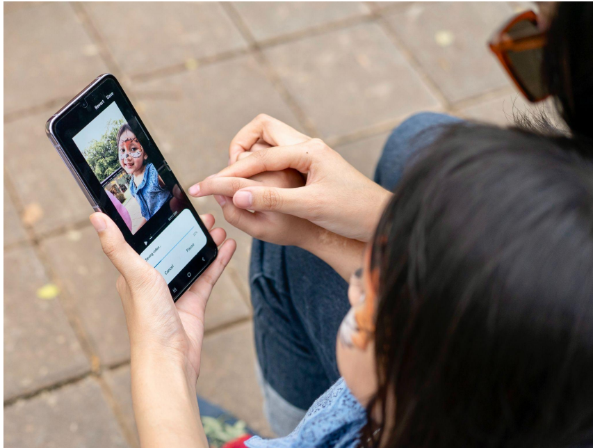
Mengajak anak memilih filter dan musik untuk konten Tiktok dan Reels

Ketika semua footage dari aktivitas yang dilakukan sudah selesai diambil, sekarang waktunya libatkan anak pada proses editing sampai hasil akhir dari konten yang dibuat selesai. Hal ini penting untuk membantu memahami proses pembuatan konten yang selama ini dia tonton sekaligus membiasakan anak dalam menikmati proses yang dilalui. Momen dalam proses editing ini pun juga bisa dimanfaatkan untuk bertanya pada anak mengenai perasaan mereka selama membuat konten dan memuji effort mereka.