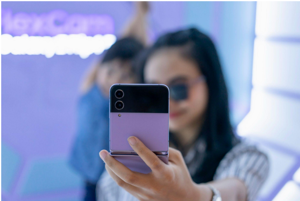
Tiga Cara Buat Konten Ala Cool Parents dengan Galaxy Z Flip4 5G

Maka dari itu, para orang tua generasi alpha, yang kebanyakan adalah generasi milenial, bisa memanfaatkan perangkat tersebut supaya lebih berguna baik untuk edukasi, hiburan, hingga sebagai salah satu perangkat untuk mengabadikan momen bersama. Kini penting bagi para orang tua untuk memiliki perangkat yang memudahkan mereka untuk explore konten-konten seru yang bisa dibuat bersama anak, lengkap dengan pengalaman membuat konten yang lebih fleksibel. Dalam hal ini, Galaxy Z Flip4 5G hadir memberi cara baru dan menarik dalam membuat konten sekaligus memungkinkan para orang tua dan si buah hati bisa seru-seruan bareng saat bikin konten.