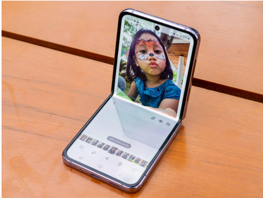
Menggunakan FlexMode Panel untuk memudahkan navigasi saat editing content

Edit konten pun bisa dilakukan dengan nyaman pakai Galaxy Z Flip4 5G. Dengan FlexMode dan FlexMode Panel, orang tua maupun anak tak perlu memegang perangkat terus-terusan saat edit konten, di mana pengoperasian bisa dilakukan layaknya pakai laptop mini. Hal ini membuat orang tua dan anak memiliki arah pandang yang sama nyamannya selama proses editing dan lebih mudah untuk berdiskusi. Momen membuat konten dari awal sampai akhir ini pun bisa dilalui dengan lancar karena Galaxy Z Flip4 5G sudah dibekali dengan all-day battery 3.700mAh, jadi orang tua dan anak bisa bebas berkreasi saat rekam footage maupun edit konten tanpa khawatir baterai akan cepat habis.