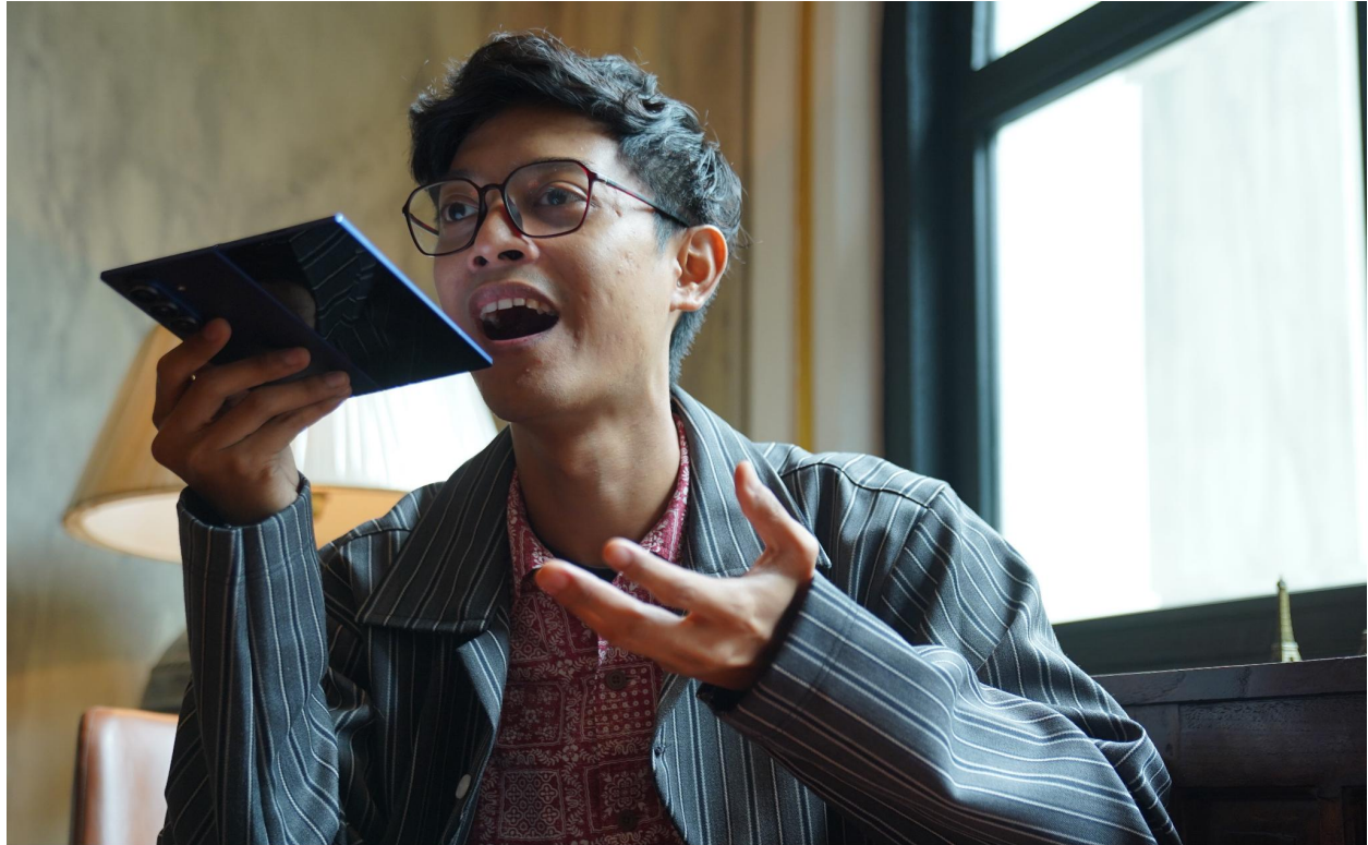
Aulion sering memanfaatkan Gemini Live untuk bisa brainstorming bersama

Tips dari Aulion biasanya saat lagi diskusi bareng Gemini Live, dirinya suka memberi prompt tambahan untuk membuat Gemini Live menjadi lebih kritis, misalnya: “Jangan langsung setuju sama ide ini. Apakah konsep ini cukup menarik buat konten sosial media?”