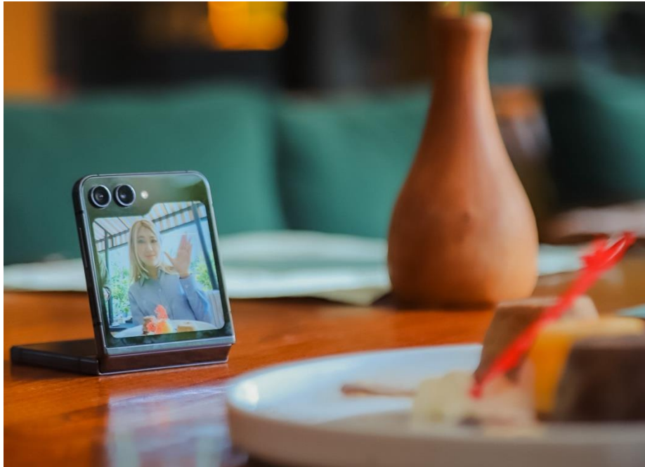
Ambil foto dengan angle terbaikmu dengan Flex Cam, yang memungkinkan kamu mengatur komposisi foto dan video dengan sangat mudah

“Aku suka banget dengan fitur FlexCam dan Flex Window di Galaxy Z Flip5. FlexCam bikin aku bisa atur sudut pengambilan gambar yang sebelumnya sulit dijangkau dengan kamera konvensional dengan lebih praktis hanya dengan menyesuaikan sudut pelipatan perangkat, baik untuk low angle maupun high angle . Untuk membuat konten food review pun menjadi lebih mudah dengan Flex Window saya bisa monitor hasil foto dari Cover Screen. Soal stabilitas, even without tripod, no shaky at all . Bisa dipegang dengan layar ditekuk, atau di taruh di tempat yang diinginkan tanpa khawatir device akan goyang,” tutur Alex.