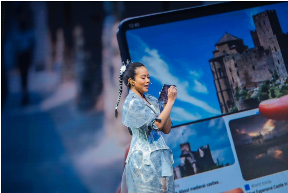
Yura Yunita bisa bebas melakukan berbagai hal di layar besar Galaxy Z Fold5 dan semakin optimal dengan dukungan S Pen

Sebagai penyanyi dan penulis lagu, Yura Yunita senang mencari inspirasi dari kehidupan sehari-hari untuk menciptakan karya yang relate dengan banyak orang. Maka dari itu, tak jarang ia multitasking dalam menjalani rutinitas untuk memastikan ide-ide yang muncul bisa terekam kapan saja. Dengan kesibukan yang semakin bertambah seiring dengan semakin banyaknya karya yang diciptakan, Yura kini memilih untuk switch ke Galaxy Z Fold5 sebagai daily driver andalannya. Alasannya, Galaxy Z Fold5 memberi kemudahan lebih bagi Yura untuk menuangkan inspirasi di segala kondisi, termasuk saat on-the-go .