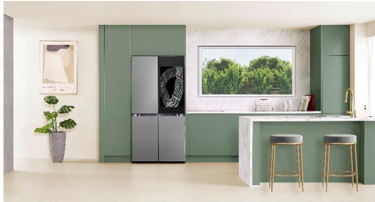
Dapur dengan Bespoke 4-Door Flex™ Refrigerator dengan AI Family Hub™+

Kemudian ada Tap View 6 , yang menawarkan kenyamanan yang lebih baik dengan memungkinkan pengguna untuk mirroring tampilan smartphone Galaxy mereka ke layar Family Hub™+ dengan mudah. Selain itu, pengguna juga dapat menikmati aplikasi YouTube dan TikTok 7 di layar kulkas untuk mendapatkan lebih banyak informasi dan hiburan.