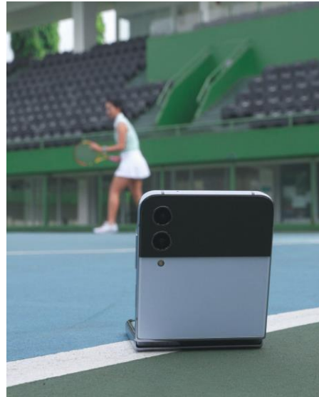
Memaksimalkan Flex Cam pada Galaxy Z Flip4 5G untuk membuat konten secara handsfree

Dengan memanfaatkan Flex Mode pada Galaxy Z Flip4 5G, Nucha bisa leluasa flexing setiap skill tenis, baik saat service , mengembalikan bola dengan backhand atau forehand , maupun dapat skor dengan teknik volley yang ciamik. Nucha pun bisa capture semua momen itu tanpa bantuan tripod , termasuk ketika ingin selfie bareng teman secara hands-free tanpa perlu memegang perangkat dengan tangan yang masih berkeringat. Dengan cara ini, tak cuma Nucha, kamu pun bisa punya banyak bahan konten kekinian yang bisa di- upload di media sosial secara instan.