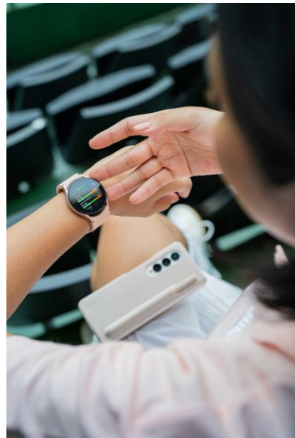
Caca memastikan kondisi tubuh tetap terjaga dengan tracking kegiatan tenis menggunakan Galaxy Watch5