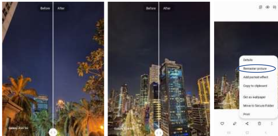
Before dan After menggunakan fitur Photo Remaster

Fitur Photo Remaster akan mengurangi blur dan noise yang ada pada foto dan meningkatkan resolusi foto, sehingga foto akan terlihat lebih tajam dan hidup, untuk menggunakan fitur Photo Remaster, kamu dapat membuka Gallery foto, pilih foto yang akan di-Remaster. Tap tanda titik tiga di pojok kanan bawah. Pilih Remaster picture dan Save . Selanjutnya, fitur Object Eraser kamu gunakan untuk menghilangkan bayangan dan pantulan yang tidak diinginkan dari fotomu.