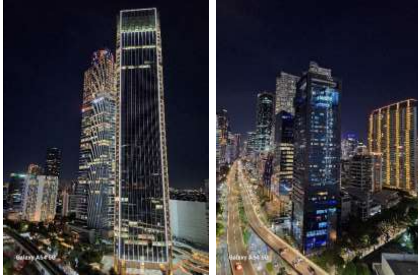
Hasil Kamera Galaxy A54 5G dengan Night Mode

Kamu juga bisa menggunakan fitur Night Mode untuk meningkatkan hasil foto menjadi lebih terang. Night Mode menggunakan multi-frame processing untuk menggabungkan 30 gambar ke dalam satu foto yang jernih. Cahaya ekstra yang ditangkap oleh sensor kamera ponsel akan membantu fotomu tampak lebih terang.