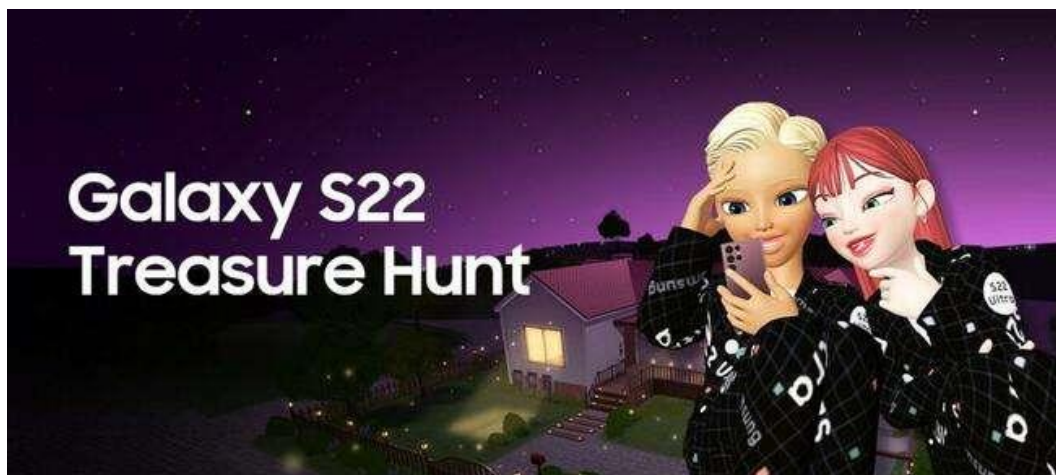
Samsung Hadirkan Kampanye Galaxy S22 Treasure Hunt yang Memberikan Pengalaman Unik di Metaverse

Jakarta, 11 April 2022 – Riset dari PwC menunjukkan bahwa sebanyak 25% masyarakat diperkirakan akan menghabiskan waktu satu jam tiap harinya di metaverse pada 2026. Hal tersebut dapat membuka lebih banyak kemungkinan dan peluang akan implementasi teknologi di keseharian, terlebih metaverse dianggap mampu menyusup ke semua lini kehidupan. Sebagai perusahaan yang konsisten berinovasi, kini Samsung hadir dengan kampanye Galaxy S22 Treasure Hunt yang akan memberikan para Galaxy Fan sebuah pengalaman unik di metaverse . Kampanye ini melengkapi kehadiran smartphone flagship Galaxy S22 Series 5G yang telah diluncurkan baru-baru ini.