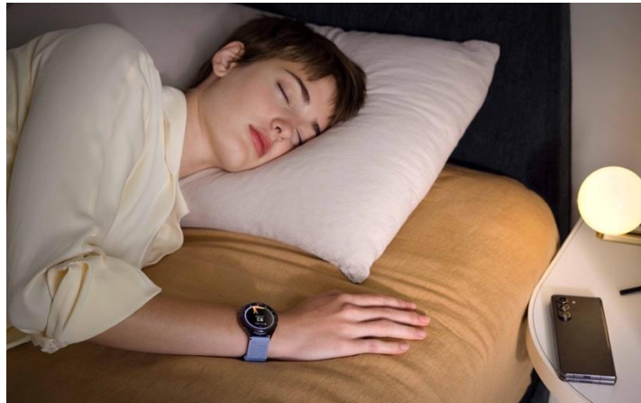
Galaxy Watch6 Series Tingkatkan Kualitas Tidur Kamu Layaknya Sleep Coach Pribadi

Menjaga kualitas tidur sangat esensial untuk menjaga kesehatan tubuh dalam mencapai work life balance . Dengan pola tidur yang baik, kamu bisa mendapatkan fisik yang lebih bugar dan kondisi mental yang lebih stabil untuk menjaga produktivitas tetap maksimal. Buat kamu yang masih mengalami masalah dalam tidur, Galaxy Watch6 Series hadir layaknya sleep coach pribadi untuk meningkatkan kualitas tidur kamu berbekal fitur-fitur yang komprehensif dan insightful .