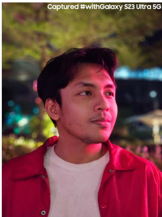
Hasil foto portrait dengan bokeh yang sangat smooth dari Galaxy S23 Ultra 5G