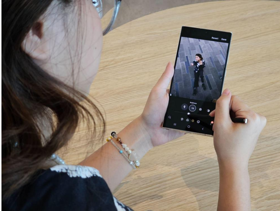
Mengedit hasil foto Portrait lebih mudah dengan In-app Gallery dari Galaxy S23 Ultra 5G

Peningkatan terkini dari fitur editing di Galeri juga ditampilkan di Photo Remaster , dimana sekarang proses remastering foto menjadi lebih optimal, termasuk dalam menghilangkan bayangan dan pantulan. Kamu bahkan bisa menambahkan efek bokeh dengan mengatur intensitas keburaman agar foto portrait hasil jepretanmu semakin epic . Proses editing pun semakin nyaman berkat penggunaan teknologi Adaptive Vision Booster yang dapat menyesuaikan tingkat kecerahan layar dengan keadaan cahaya di sekitar kamu. Dengan demikian, kamu tidak perlu khawatir layar akan gelap saat mengedit konten bahkan di bawah terik cahaya matahari.