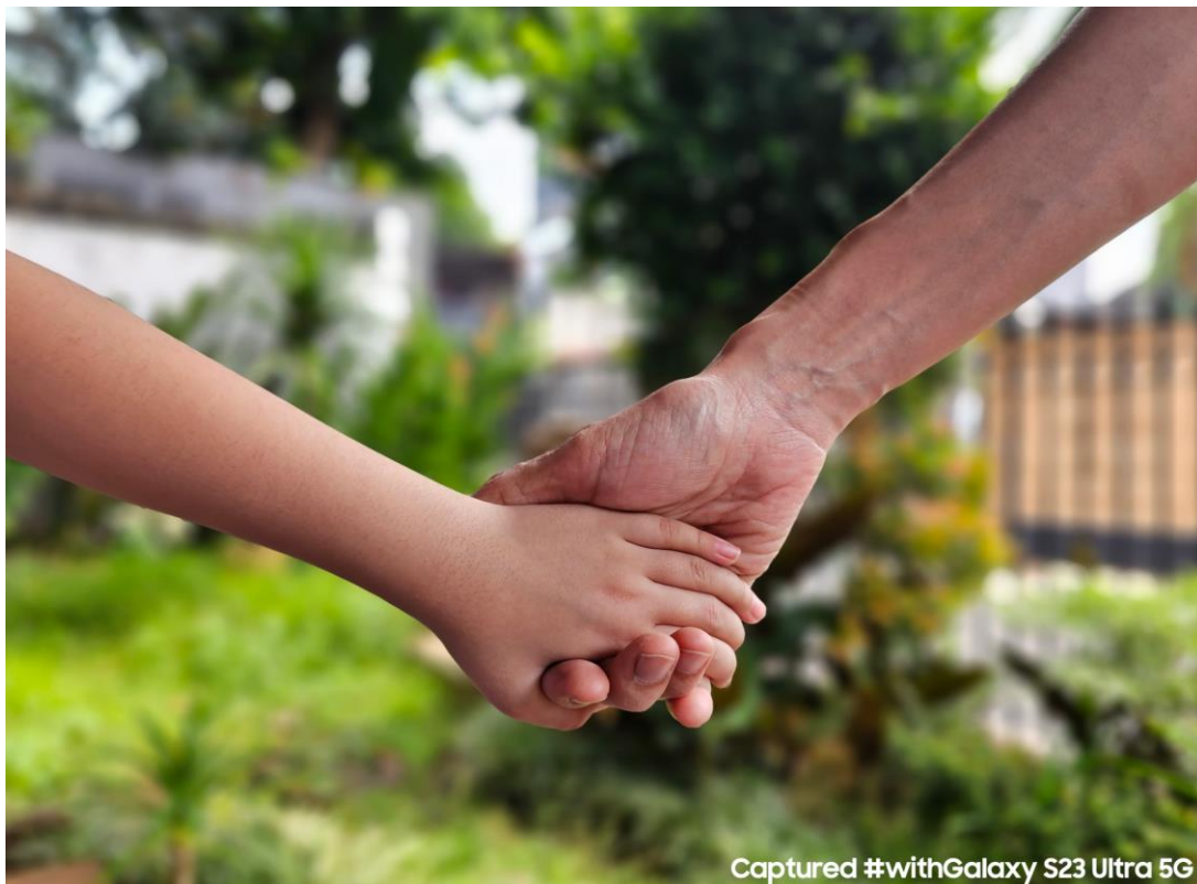
Foto detail diambil dengan sangat tajam menggunakan fitur Portrait dari Galaxy S23 Ultra 5G

kamu dapat dari foto tersebut. Kamu bisa menyesuaikan ISO, White Balance, dan Exposure Value hingga mendapatkan foto detail yang epic .