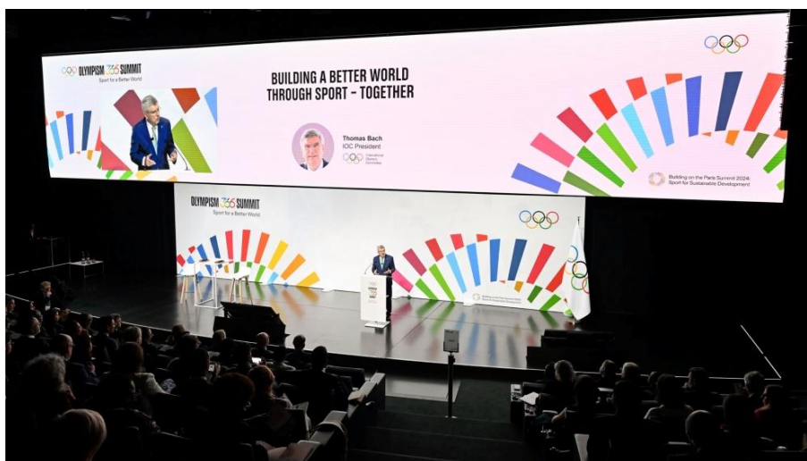
▲ IOC 主席 Thomas Bach 在國際奧委會青年峰會發表主題演講

為期三天的高峰會，匯聚來自奧林匹克運動會、聯合國機構、開發與融資機構、非政府組織、公益型企業、運動安全倡議團體，以及國際奧委會青年領袖計畫等共計 100 個組織、逾 250 位代表齊聚一堂，攜手推動聯合國永續發展目標 (SDGs) 於運動領域中的具體實踐與跨界合作。