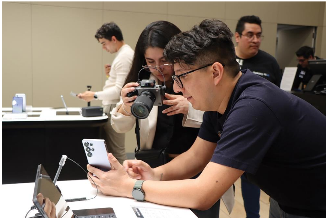
▲ 墨西哥城 Santa Fe 購物中心的 Galaxy 體驗空間