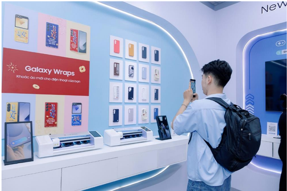
▲ 越南胡志明市的 Galaxy AI Sai Gon Terminal

Galaxy S25 旗艦系列進一步強化 Galaxy 體驗中不可或缺的核心功能，使其更加完善。全系列搭載 Galaxy 專屬 Qualcomm Snapdragon® 8 Elite 行動平台 ，為終端裝置作業注入動能，成就更即時的 AI 體驗。Galaxy S25 旗艦系列更借助 ProScaler (註九) 和三星的行動數位自然影像引擎 ( mDNle ) 等各種獨特的客製技術，提升 AI 影像處理及顯示螢幕的能效表現。Galaxy S25 Ultra 獨家搭載新型 5,000 萬畫素超廣角鏡頭 感光元件，無論遠近均可拍出清晰無比的一流美照。 Virtual Aperture 和 Samsung Log 等專業級控制選項，讓每一張相片或影片都能輕鬆成就終極視覺盛宴。