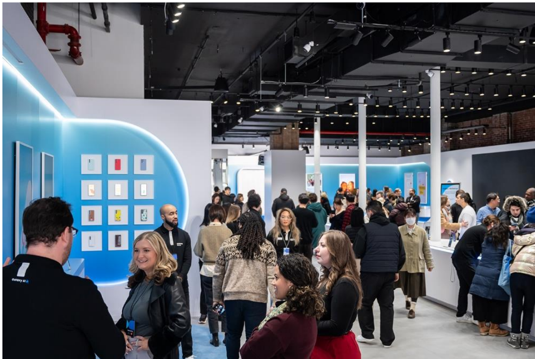
▲紐約百老匯 500 號的 Galaxy 體驗空間

三星電子宣布全新 Galaxy S25 旗艦系列現正於全球熱烈開賣中，隨 One UI 7 作業系統登場的 Gemini 共支援 46 種語言 (註一) ，讓使用者在各種三星與 Google 應用程式間自在切換，享受行雲流水般的互動體驗。