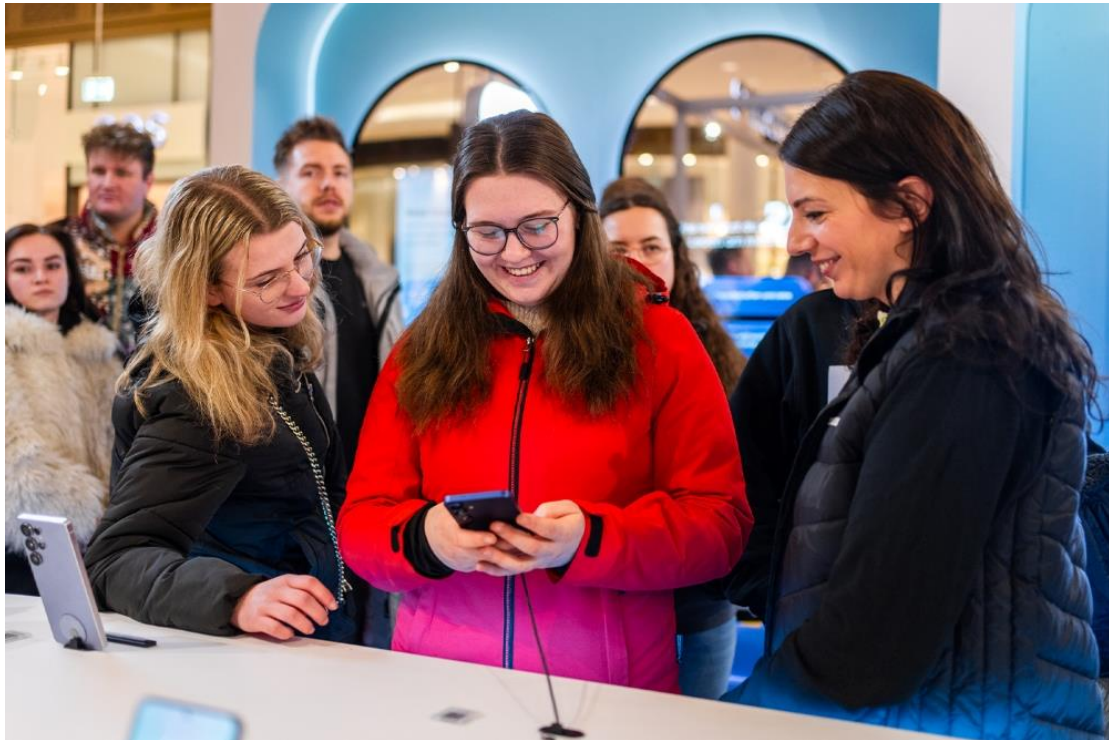
▲ 德國柏林的 Galaxy 體驗空間

註一：支援語言包括阿拉伯文、孟加拉文、保加利亞文、中文(繁體/簡體)、克羅埃西亞文、捷克文、丹麥文、荷蘭文、英文、愛沙尼亞文、波斯文、芬蘭文、法文、德文、希臘文、古吉拉特文、希伯來文、印地文、匈牙利文、印尼文、義大利文、日文、坎那達文、韓文、拉脫維亞文、立陶宛文、馬拉雅拉姆文、馬拉地文、挪威文、波蘭文、葡萄牙文、羅馬尼亞文、俄文、塞爾維亞文、斯洛伐克文、斯洛維尼亞文、西班牙文、史瓦希利文、瑞典文、坦米爾文、泰盧固文、泰文、土耳其文、烏克蘭文、烏爾都文和越南文。