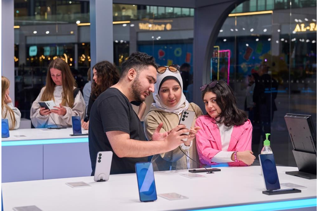
▲ 杜拜 The Bay Festival City Mall 的 Galaxy 體驗空間

Galaxy S25 旗艦系列的 One UI 7 (註二) 平台整合了具備多模態功能的 AI 智慧助理，可流暢無礙地執行跨應用程式的複雜任務，並以語音、文字、影片和圖像自然地與用戶互動。 Now Brief (註三) 提供全天候個人專屬建議； Now Bar (註四) 則化身全新資訊中心，讓進行中的活動一目了然。無論是利用 寫作智慧助理 提升生產力，或是以 繪圖智慧助理 (註五) 解鎖無限創意， Galaxy AI (註六) 的升級功能將持續為使用者日常生活提供全方位的應援。