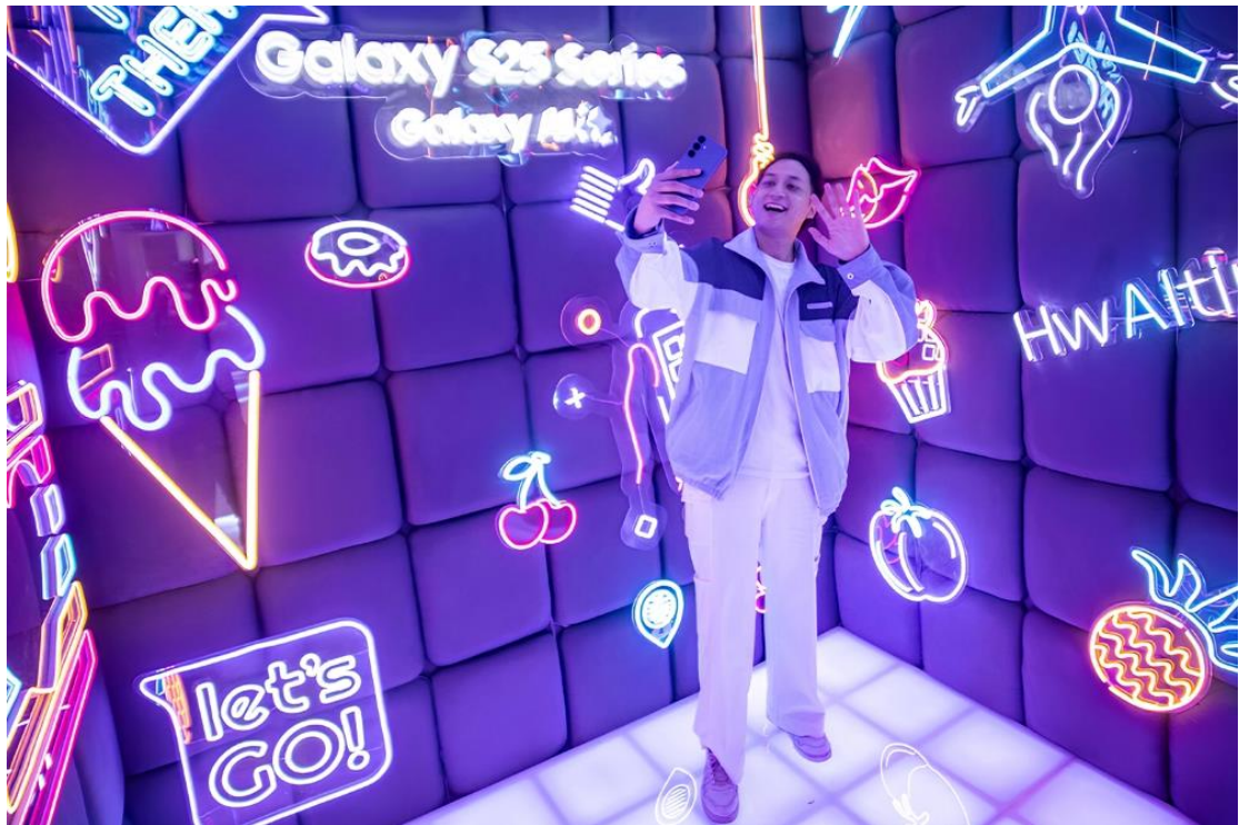
▲ 印尼雅加達 Kota Kasablanka 購物中心的 Galaxy 體驗空間

Galaxy S25 旗艦系列是業界首款支援 內容憑證 ( Content Credentials ) 的智慧型手機陣容，該技術基於 內容出處與真實性聯盟 ( Coalition for Content Provenance and Authenticity, C2PA ) 制定的開放技術標準。三星亦正式加入 C2PA，攜手 Adobe、Microsoft、OpenAI、Google、陽獅集團等業界龍頭，致力推動內容憑證成為數位內容來源的流通標準。為實踐對負責任行動 AI 創新的承諾，三星將此標準應用於生成式 AI 所創作和編輯的內容，藉此提升透明度。