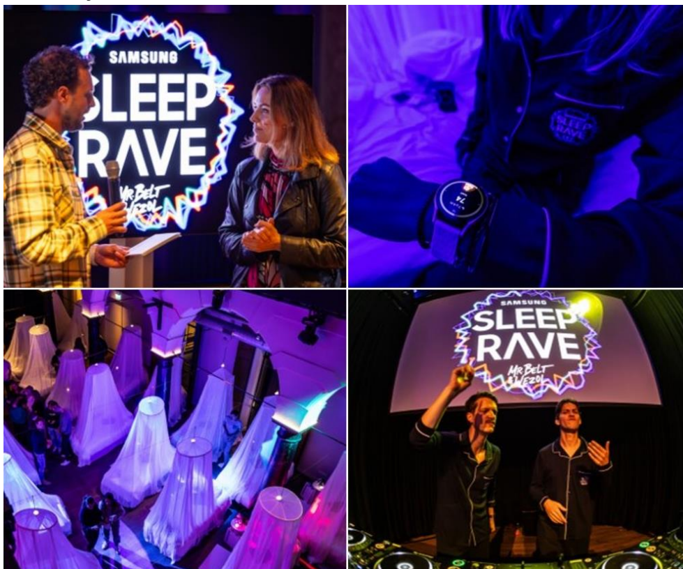
▲ 荷蘭 Sleep Rave 活動照片。