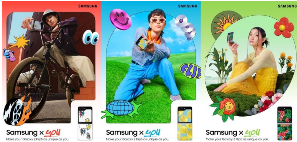
▲ 「Samsung x You」活動海報。

三星於東南亞及大洋洲（SEAO）推出「Samsung x You」活動，讓用戶以前所未有的方式探索裝置個人化的無限可能。活動展示 Galaxy Z Flip5 系列豐富的配件陣容，邀請星粉透過專屬裝置，展現自我風格。此外，三星亦與當地知名藝術家及品牌合作，推出融合文化設計與元素的地區限定配件，並提供獨特的顏色、主題與設計供用戶挑選。「Samsung x You」活動以年輕世代為中心，將陸續擴展至全 SEAO 市場，包括澳洲、印尼、馬來西亞、紐西蘭、菲律賓、新加坡、泰國與越南。