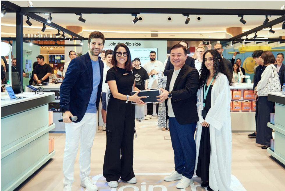
▲ 三星電子總裁暨行動通訊事業部負責人盧泰文博士出席 Galaxy Z Flip5 禮盒發表會。