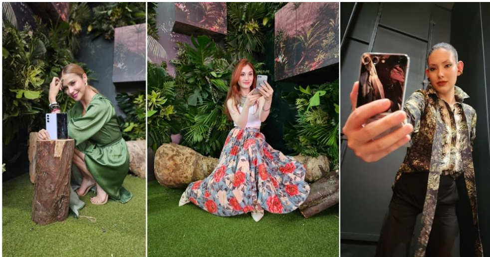
▲ 模特兒手持 Galaxy Z Flip5 演繹 Diego Guarnizo 的時裝作品。

為支持時尚界的環保行動，Galaxy Z Flip5 化身模特兒的時尚配件，登上 哥倫比亞時裝週 伸展台。活動展現 Galaxy Z Flip5 對永續的承諾，與當地設計師 Diego Guarnizo 的綠色時尚理念完美契合。為強調永續宗旨，身穿 Guarnizo 設計系列的模特兒帶著 Galaxy Z Flip5 在歡樂的快閃走秀中亮相，隨後直接在 Galaxy Z Flip5 展區與觀眾進行互動。三星與 Guarnizo 在哥倫比亞時裝週的合作彰顯環境永續的重要性，以及三星在裝置零件中導入廢棄漁網和寶特瓶等再生材料的實績。