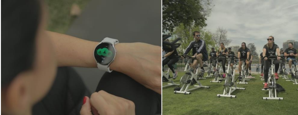
▲ 第一屆 Watch6 健康生活節於智利聖地牙哥舉辦。

三星於智利聖地牙哥的威爾斯親王鄉村俱樂部（Prince of Wales Country Club）舉辦 Watch6 健康生活節 ，邀請運動愛好者與健身迷共襄盛舉。與會者在專業教練指導下，體驗瑜珈、飛輪和混合健身等各式運動課程。每堂課的運動數據皆完整記錄在與會者的 Galaxy Watch6 中，提供包括心率、身體組成、血氧、運動長度等深度體適能洞察數據。