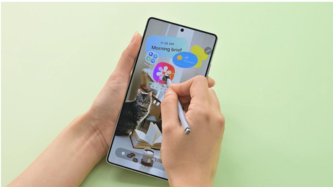
▲使用 DIY 主螢幕功能將應用程式藏在貼圖下方

用戶還能善用貼圖與圖層工具等裝飾性元素，巧妙隱藏應用程式圖示，增加創意巧思。只需將貼圖加入主螢幕，並覆蓋於應用程式圖示上，即可調整圖層設定。此搭配將貼圖變身為趣味捷徑，輕觸便能啟動隱藏的應用程式。