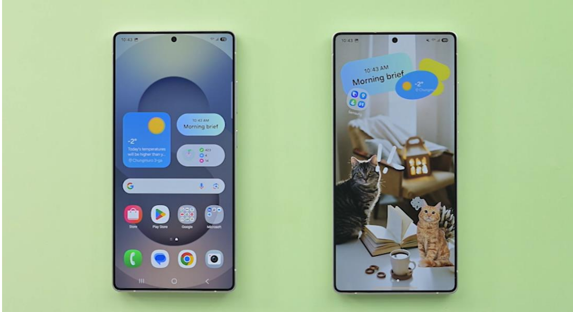
▲ (左起) 主頁面手勢動畫功能以經典和俏皮兩種模式顯示

Good Lock 內建的 Home Up 模組集結多項實用工具，可依照個人品味自訂專屬的裝置主螢幕。在本系列下一篇報導中，三星新聞中心將鎖定 Good Lock 三大熱門功能，揭開全球星粉的最愛工具。