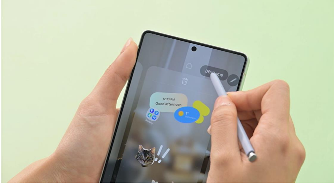
▲ DIY 主螢幕

用戶還能善用貼圖與圖層工具等裝飾性元素，巧妙隱藏應用程式圖示，增加創意巧思。只需將貼圖加入主螢幕，並覆蓋於應用程式圖示上，即可調整圖層設定。此搭配將貼圖變身為趣味捷徑，輕觸便能啟動隱藏的應用程式。