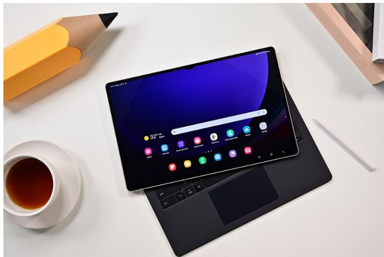
▲ Galaxy Tab S9 系列的書本式鍵盤皮套（註九）

Galaxy Tab S9 系列搭載 One UI 5.1.1，能自動辨識 S Pen 手寫筆跡，並轉換成 Samsung Note 數位文字。此外，S Pen 能讓用戶擷取圖像文字內容，並透過幾個輕觸操作，輕鬆儲存資訊。