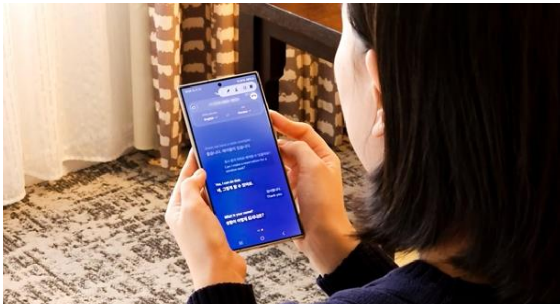
▲三星新聞中心利用「通話即時翻譯」致電餐廳訂位。

為了順利完成餐廳訂位，來自三星新聞中心的韓籍編輯先輕觸 Galaxy S24 Ultra 上的「通話即時翻譯」按鍵，接著撥打餐廳的訂位專線。電話接通時，螢幕畫面會自動出現一則訊息：「您好，此通電話正在進行翻譯並提供即時字幕 (Hello. This call is being translated and live captioned. ) 。」