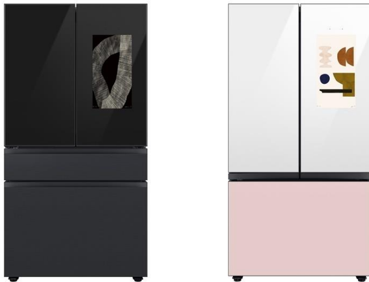
▲ 三星推出的 Bespoke Family Hub 冰箱

問：過去二年，人們生活的方式發生巨大變化，非接觸的互動模式逐漸成為新常態，也因此有助於拉近人際關係的科技變得日益重要。您認為於 CES 2022 中所展示的產品及科技，將對人們生活產生何種影響呢？