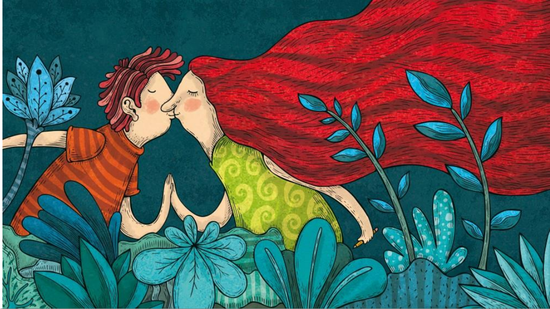
▲ Alberto Montt 畫作《Beso 親吻》

《Beso 親吻》這幅作品，是出現在一本哥倫比亞所出版、探討好奇心與情感覺醒書籍的插畫。在這本書的眾多插畫之中，我最喜歡這一幅，那欣欣向榮的花草，令人神往。