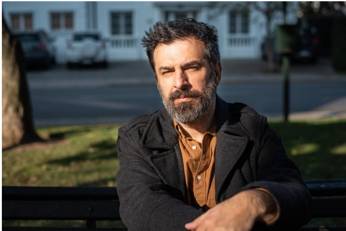
▲ Alberto Montt

Alberto Montt 最為人津津樂道的特色，是結合異材質的實驗性藝術創作，讓人們以嶄新視角欣賞作品。隨著數位藝術型態與新媒體大行其道，三星新聞中心特別專訪 Alberto Montt，暢談其對創作與數位藝術的看法。