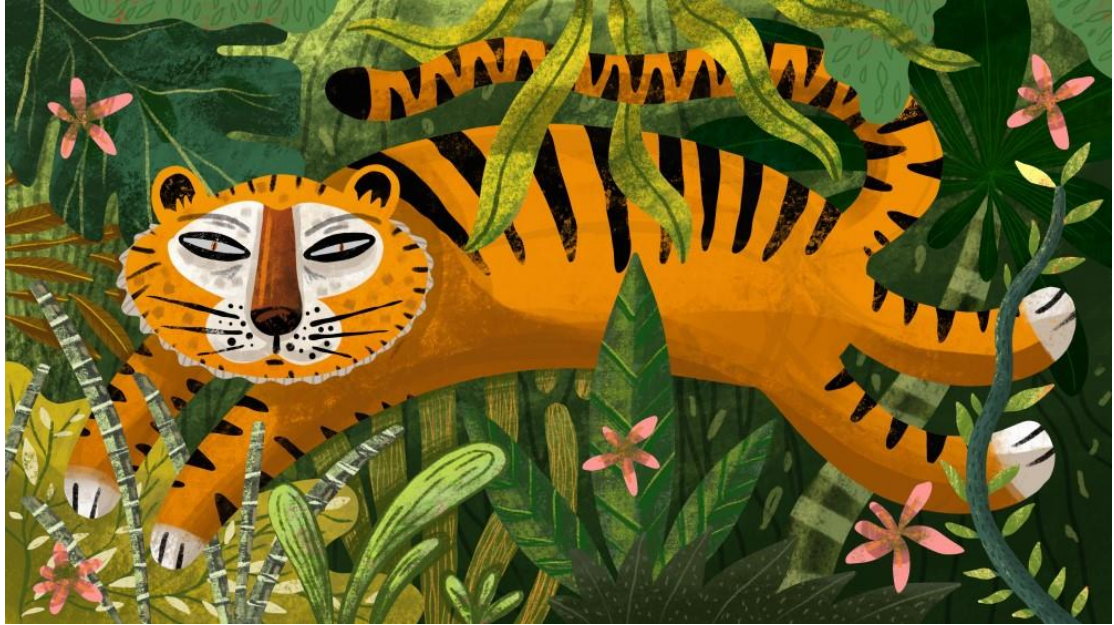
▲ Alberto Montt 畫作《Tigre 老虎》

《Tigre 老虎》像是一種視覺訓練，瞬間將我拉回童年。我在厄瓜多的叢林長大，雖然那裡並沒有老虎，但樹葉、繽紛的色彩，以及那片蒼翠綠蔭，沁入心田、深深打動著我。