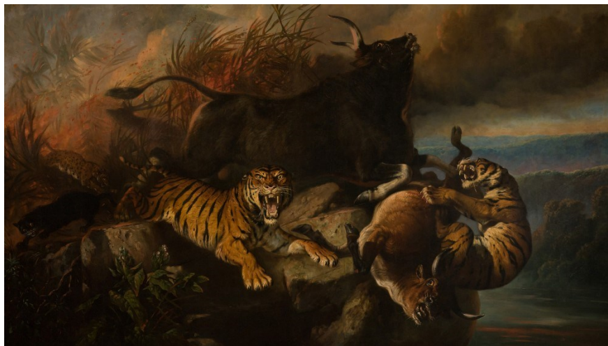
▲ Raden Saleh 於 1849 年繪製的《Boschbrand》( 森林之火 )

自四月與三星合作以來，《Boschbrand》( 森林之火 ) 為本館於三星「藝術市集」展示作品中，最具指標性的一件珍品。雖然它並非藝術市集的最新成員，但具有非凡的藝術價值，其描繪野生動物被森林野火逼至斷崖邊的情景，展現強烈的戲劇張力。印尼大師級畫家 Raden Saleh 於 1850 年完成此畫，並贈予荷蘭國王威廉三世。它是一幅巨型畫作；我們很高興 The Frame 美學電視用戶可以在舒適的家中，展示和欣賞這幅名作。