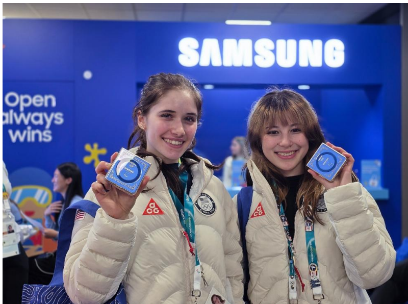
▲美國花式滑冰選手 - 包括 Team Samsung Galaxy 選手、2026 年米蘭 - 科爾蒂納冬奧金牌得主 Alysa Liu，於奧運選手村 Samsung Open Station 展示 Galaxy Z Flip7 奧運特別版

在 2026 年米蘭 - 科爾蒂納冬奧期間，三星為近 3,800 位奧運與帕運選手提供 Galaxy Z Flip7 奧運特別版。這款如口袋般迷你的智慧裝置，化身參賽選手的貼身神隊友，從選手村生活到站上頒獎台，全面應援每一刻。