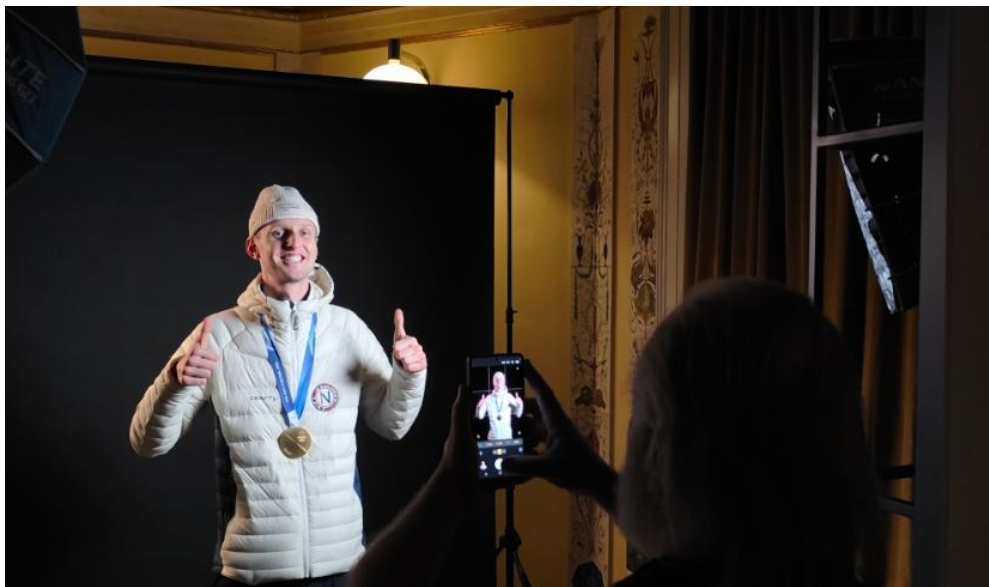
▲挪威競速滑冰名將、5000 公尺金牌得主 Sander Eitrem 現身 Samsung House， 並以 Galaxy S25 Ultra 拍攝「勝利側寫 ( Victory Profile )」

此外，三星精心打造 Olympic Edition Gallery，讓人們一窺其與奧運的深遠淵源，展示歷年推出的「奧運特別版」，為三星近四十年的技術創新傳承，與當代的 2026 年米蘭 - 科爾蒂納冬奧賽事，搭起一座穿越時空的橋樑。