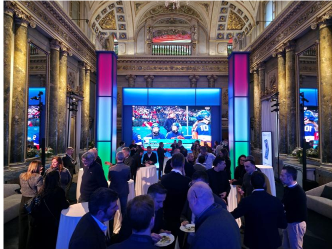
▲位於義大利米蘭歷史建築「塞爾貝洛尼宮」的 Samsung House 場景一隅

Samsung House 舉辦一系列精彩活動，包括國家奧委會之夜、賽事現場直播、選手見面會、媒體交流及利害關係人會議，於競技場外開闢一個交流觀點、分享喜悅的空間。