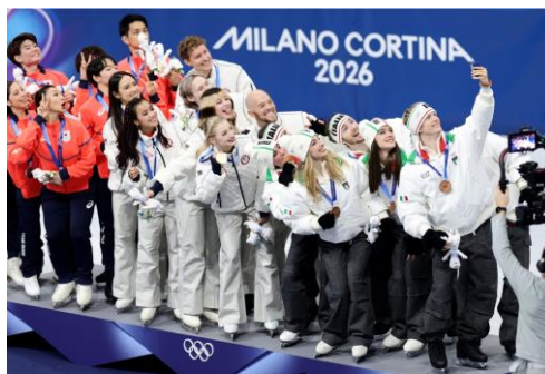
▲ 金牌得主美國隊、銀牌得主日本隊、銅牌得主義大利隊在花式滑冰團體賽後合影留念，慶祝勝利時刻。

在奧運頒獎台上，分享畢生難得的光榮時刻，是一種自然本能。「勝利自拍」透過運動員親自記錄，定格真情流露的一刻，捕捉人際互動、自我表達、分享榮耀的精彩瞬間。