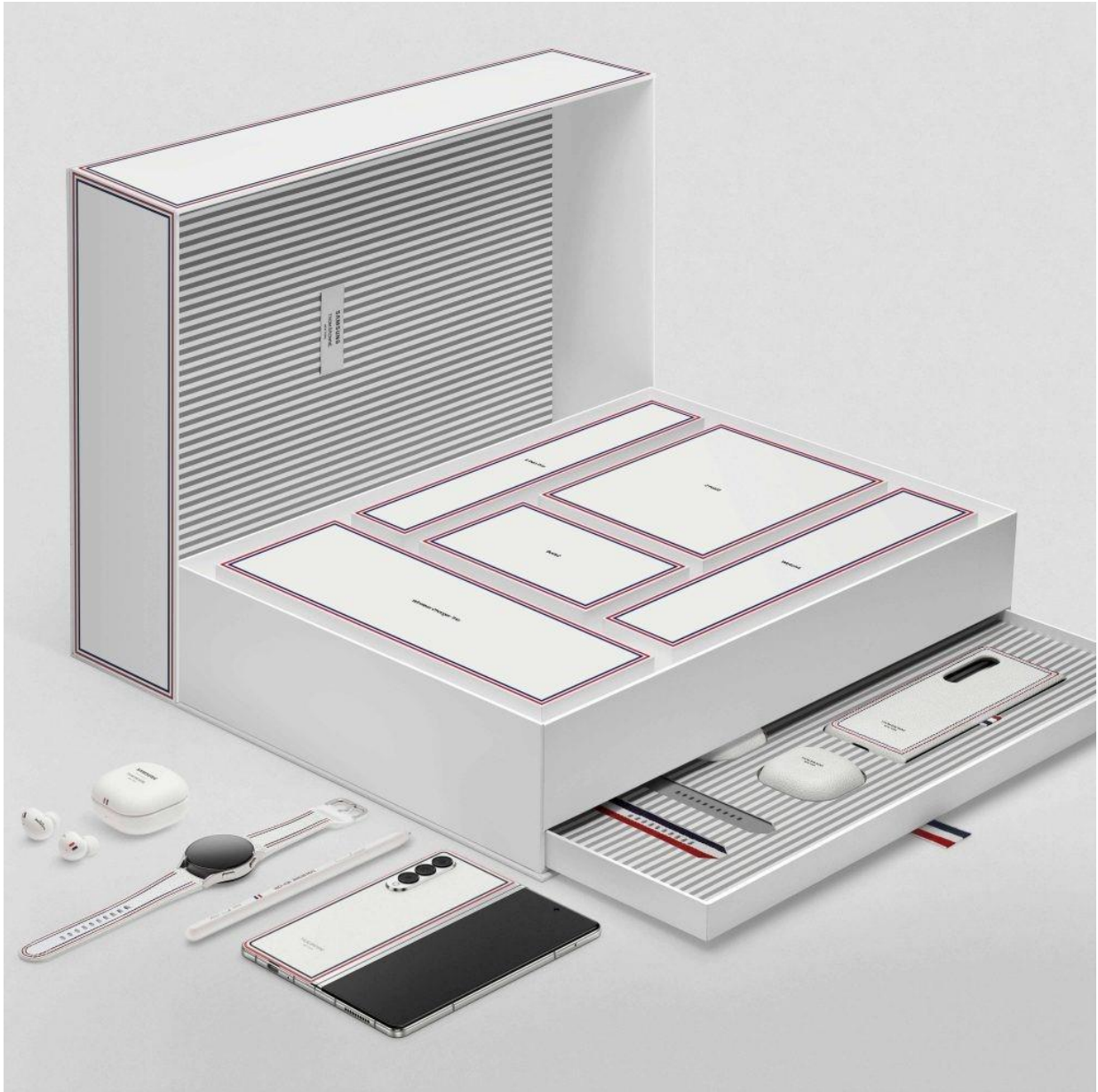
▲ Galaxy Z Fold3 Thom Browne 限量版盒裝內容，

包括：Galaxy Z Fold3 和 S Pen Pro、Galaxy Watch4（40mm 版本）、Galaxy Buds2、專屬手機殼與錶帶配件。