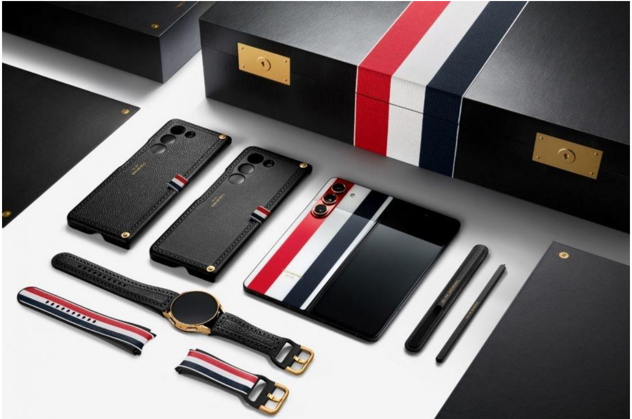
▲ Galaxy Z Fold5 Thom Browne 限量版盒裝內容，包括：Galaxy Z Fold5 和 S Pen、Galaxy Watch6 ( 40mm 版本 )，以及專屬手機殼、S Pen 保護套與錶帶配件。

此外，Galaxy Z Fold5 Thom Browne 限量版推出的保護殼，展現對細節的極致苛求，其採用布洛克雕花設計，搭配 Thom Browne 獨家的黑色荔枝紋皮革。產品外包裝的設計靈感源於與正裝相得益彰的公事包，打造令人回味無窮的開箱體驗。最新登場的 Galaxy Z Fold5 Thom Browne 限量版承襲 Galaxy Z 系列一貫的卓越設計，精雕細琢每處細節。