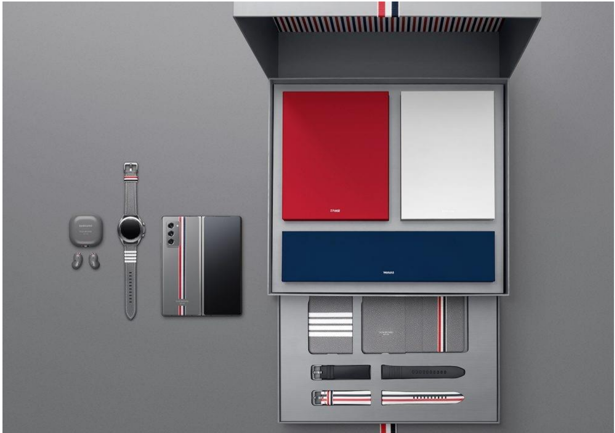
▲ Galaxy Z Fold2 Thom Browne 限量版盒裝內容。

包括：Galaxy Z Fold2、Galaxy Watch3 (41mm 版本)、Galaxy Buds Live 以及專屬手機殼與錶帶配件。