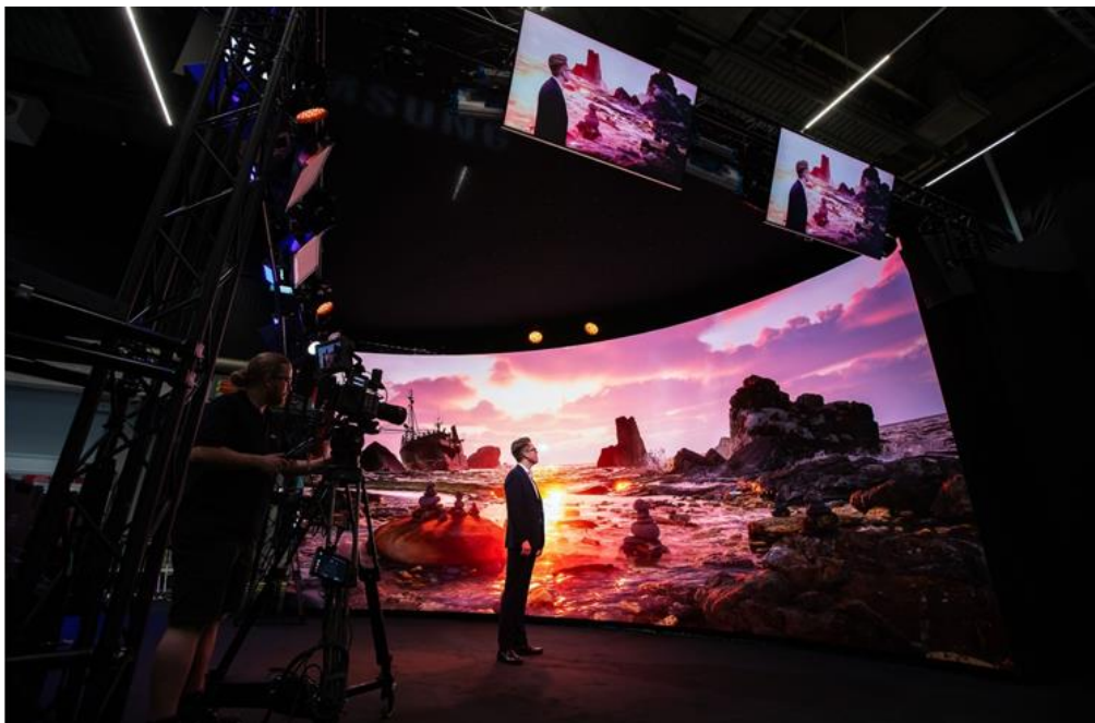
▲ The Wall for Virtual Production 使電視、電影等創意產業的製作流程變得更快、更輕鬆。

今年稍早推出的 The Wall for Virtual Production （型號：IVC），是闡述企業、製片人和創意人員如何以無與倫比的畫質，創作和展示藝術的成功實例。此款加入 The Wall 產品陣容的生力軍，讓創意工作者可利用超大型 LED 電視牆創造虛擬場景，並與即時視覺特效相互整合，減少內容製作的時間和成本。The Wall 系列的最新力作，使電視、電影和其他產業的製片速度更快、更容易，在 InfoComm 2023 和國際廣播大會（IBC）等產業盛事上備受矚目。