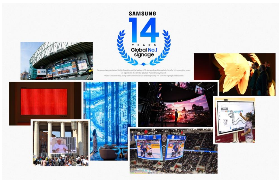
▲三星大型商用顯示器在 2023 年以先進的沉浸式體驗，全面深化各領域應用。

讓我們透過以下報導，一窺三星如何在數位看板產業的全盛時期，連續 14 年引領全球技術發展。