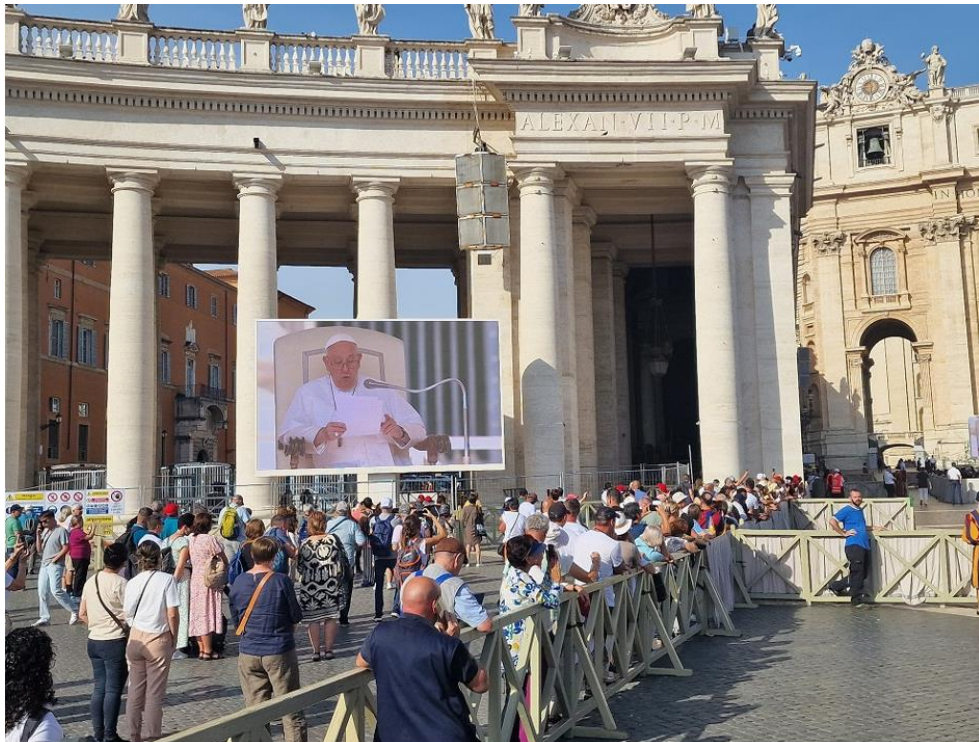
▲遊客與信徒可透過架設於梵蒂岡城聖彼得廣場的三星戶外 LED 看板 (XHB 系列，兩座尺寸為 7.935 公尺×4.83 公尺，另兩座尺寸為 5.865 公尺×3.105 公尺)，以清晰的畫質同步觀看典禮。

在此轉型時期，數位看板扮演舉足輕重的角色。梵蒂岡城的中心就是一個完美案例。歷史悠久的 梵蒂岡城聖彼得廣場 ，吸引世界各地的遊客前來朝聖，並把握難能可貴的機會參加教皇舉行的神聖儀式。