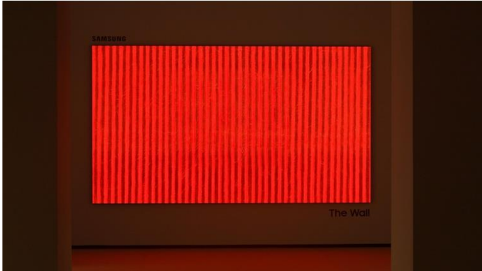
▲已故朴栖甫大師的經典作品《Écriture》系列首度以數位方式展演

(影片名稱：[1 OF 0]，由 Jifan Park 執導)，透過 The Wall 顯示器的 146 吋 4K 螢幕絕美詮釋。