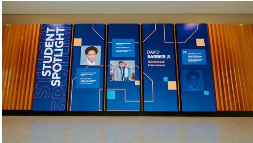
▲The Wall 展示雪城學子的學業成就，和鼓舞人心的求學故事， 協助有意就讀該校的新生展望光明未來。

現在，教師們可以更快進入課程，擁有更多時間為學生打造身臨其境的互聯學習體驗。這樣的正面效應獲得正視，事實上，三星今年在全球最盛大的教育技術展 - 英國教育培訓與技術 ( Bett )，以及國際教育技術協會 ( ISTE ) 上，發表專為學生而設計的新款互動式顯示器 ( 型號：WAC )。