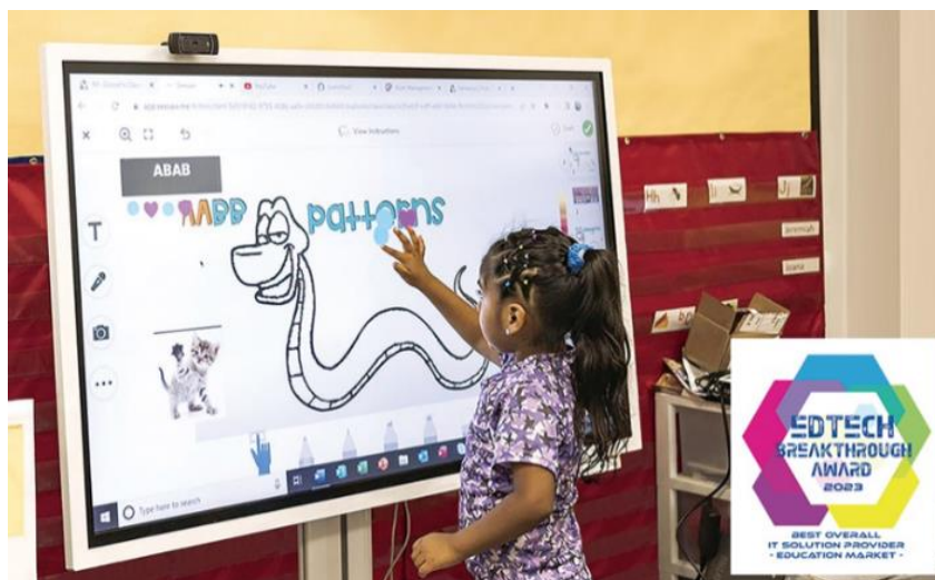
▲Hogg New Tech Center 使用三星的互動式白板 Flip Pro ( 型號：WMB )， 借助多點觸控功能和多元連接埠，提升互動式學習與協作。

從 The Wall、LED 看板到互動式顯示器，三星憑藉一應俱全的顯示解決方案，被 2023 EdTech Breakthrough Awards 評選為「教育市場最佳整體 IT 解決方案供應商 ( Best Overall IT Solution Provider for the Education Market )」。