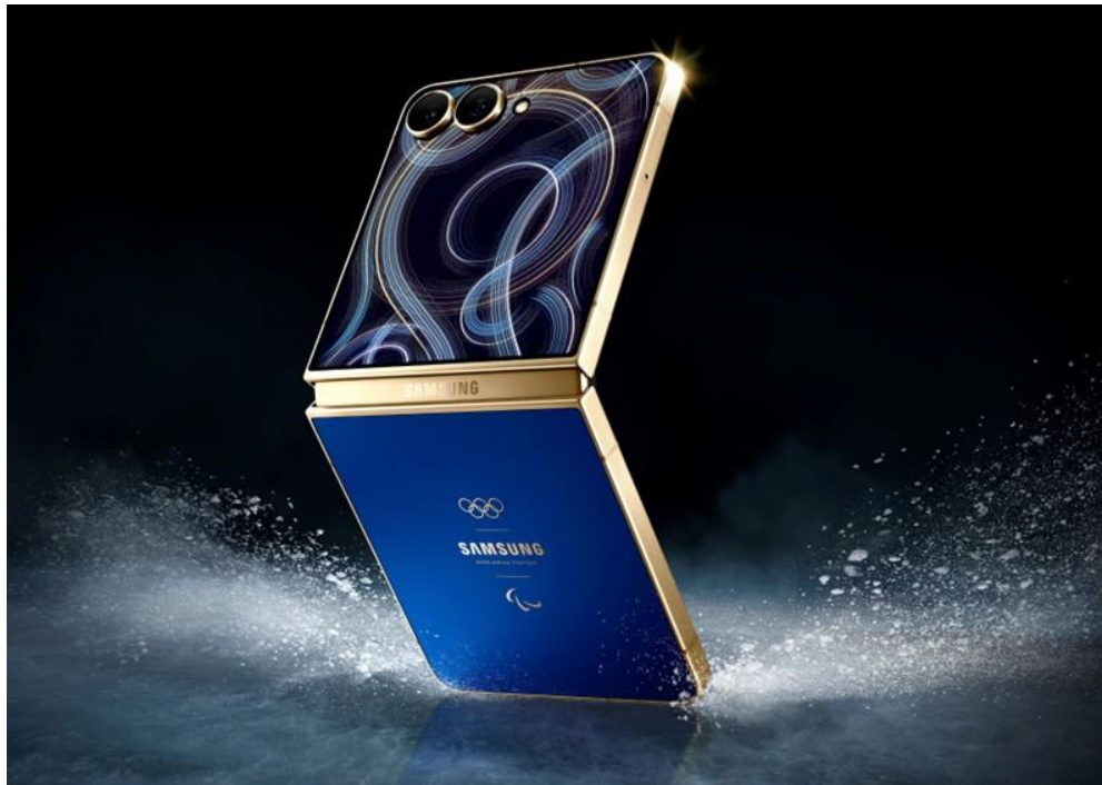
▲ 三星為 2026 年米蘭 - 科爾蒂納冬季奧運會打造 Galaxy Z Flip7 奧運特別版

奧運與帕運全球合作夥伴三星電子，發表專為 2026 米蘭科爾蒂納冬季奧運會與帕運參賽選手量身打造的 Galaxy Z Flip7 奧運特別版 (註一) 。這款特殊版本將提供給來自約 90 個參賽地區、近 3,800 名的奧運與帕運選手，在賽事期間全程陪伴，記錄選手村日常生活，捕捉並分享從競技場到頒獎台的每個珍貴瞬間。