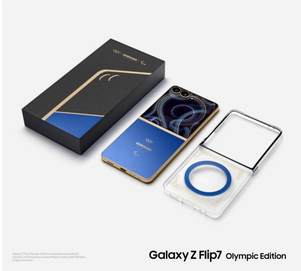
▲ 三星 Galaxy Z Flip7 奧運特別版盒裝

除了上述功能，Galaxy Z Flip7 奧運特別版更以指標性設計表彰冬季奧運與帕運參賽者，同時提供實用服務，提升在選手村與賽事期間的體驗。