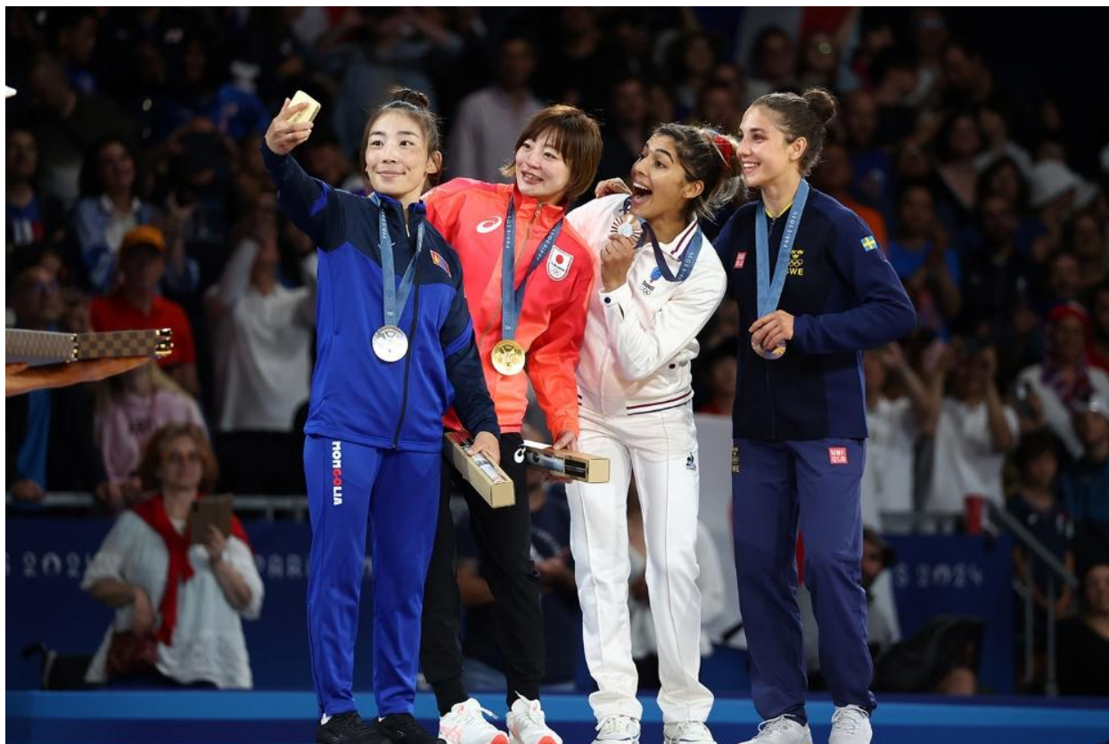
▲ (左起) 2024 巴黎奧運蒙古隊銀牌得主 Baasankhuu Bavuudorj、日本隊金牌得主角田夏實 (Natsumi Tsunoda)、以及法國隊 Shirine Boukli 與瑞典隊 Tara Babulfath 兩位銅牌得主，在女子 48 公斤級柔道賽事後進行「勝利自拍」( Victory Selfie)。

「勝利自拍 (Victory Selfie)」首創於 2024 巴黎奧運，透過奧運特別版手機，讓選手能在領獎台上以第一人稱視角記錄奪牌瞬間，讓榮耀時刻與粉絲更加緊密相連。