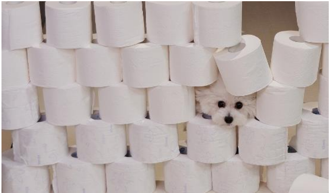
Ara 從一堆捲筒衛生紙中的小洞探出頭。運用快速截取即可捕捉生動又清晰的畫面