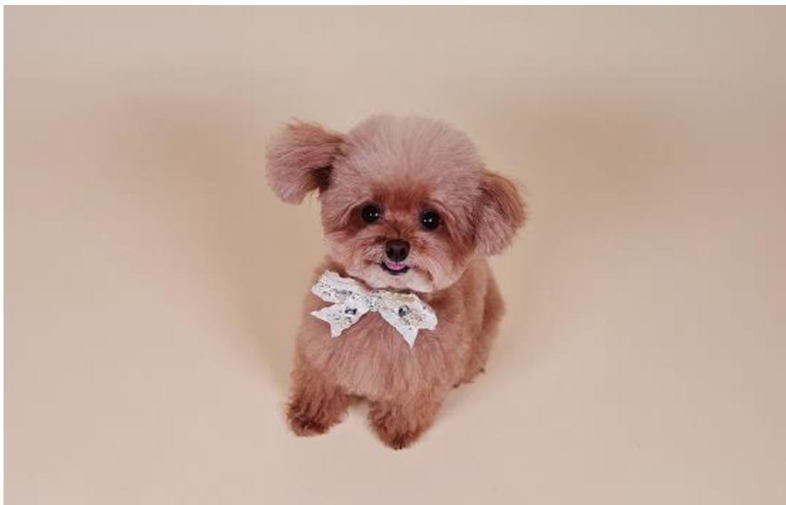
Miso 最愛拍照了，開心時耳朵會往上揚