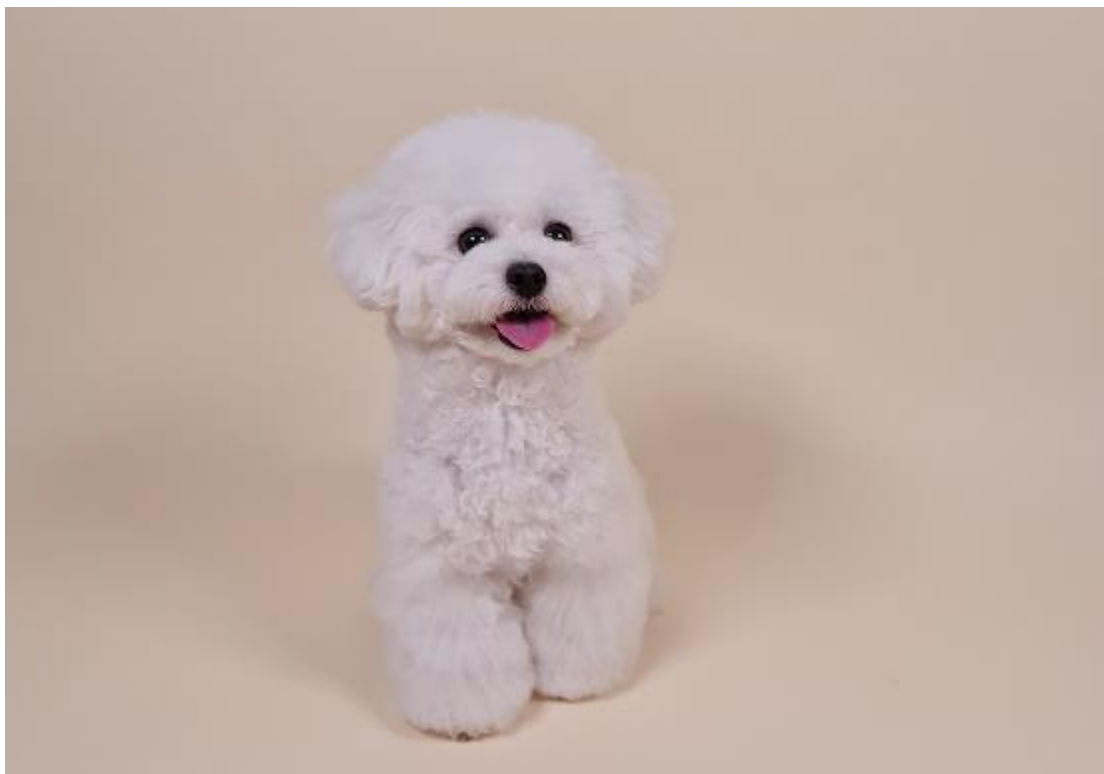
可愛的 Ara 在熟悉的環境就能拍出如此真實、快樂的模樣，讓人看了不禁微笑

Galaxy Note20 Ultra 搭載 1 億 8 百萬畫素超高解析度相機，可清楚捕捉如毛髮紋路、眼睛顏色