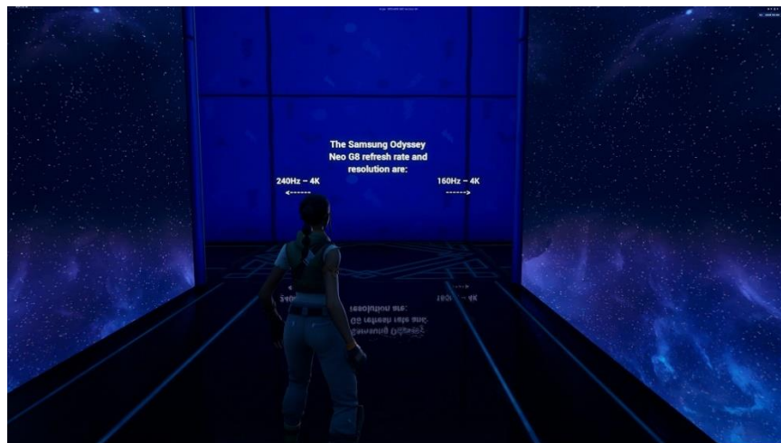
▲ Odyssey Universe 的 Level Ark 關卡。 玩家必須解開有關 Odyssey 系列的所有謎題，才能從迷宮中全身而退。

讓我們先來解鎖 Level Ark 關卡。玩家須於 Level Ark 回答有關 Odyssey 的問題，才能完成脫離迷宮的任務。為解鎖不同的迷宮通道，玩家必須運用腦中的 Odyssey 知識量來解謎。