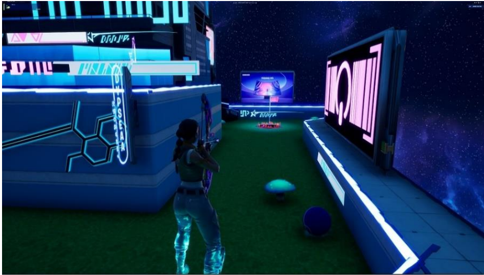
▲Odyssey Universe 的 Level G9 關卡。