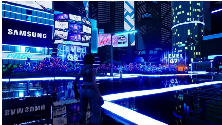
▲ 玩家一進入《Odyssey Universe》地圖，將從場景大廳踏出遊戲的第一步。 以 Odyssey 電競螢幕為設計藍圖的五個異次元，在前方等待玩家一探究竟。

玩家一進入《Odyssey Universe》，映入眼簾的是雄偉的核心場景大廳，由此通往五個不同的異次元，而每一個異次元，各設有一道關卡。此五大異次元按等級排列，分別為 Ark、G9、G8、G7 和 G6，其設計與命名靈感來自三星 Odyssey 奧德賽電競螢幕系列。