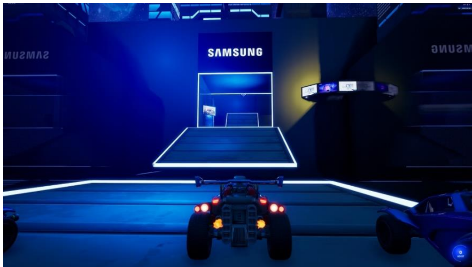
▲Odyssey Universe 的 Level G8 關卡。

Level G8 關卡是一條充滿曲折彎路的賽道，象徵 Odyssey Neo G8( 1000R )與 Odyssey OLED G8( 1800R ) 的螢幕曲率。玩家沿賽道行駛時，將開啟一望無際的 360 度宇宙新視野，享受百分百沉浸式視覺盛宴。Level G8 關卡共有二項挑戰：玩家需一邊與時間賽跑，一邊數著沿路出現的顯示器數量。